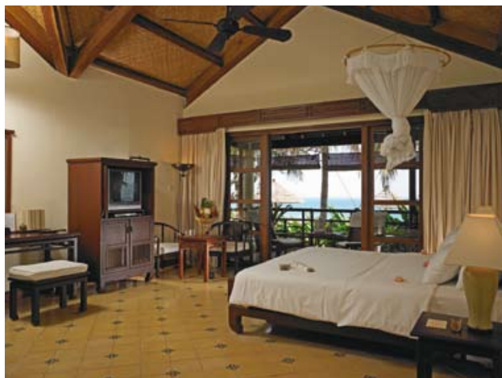
Bathroom - Deluxe Sea view Villa

*SUSTAINABLE - LOCAL - ORGANIC - WHOLESOME LEARNING - INSPIRING - FUN - EXPERIENCES