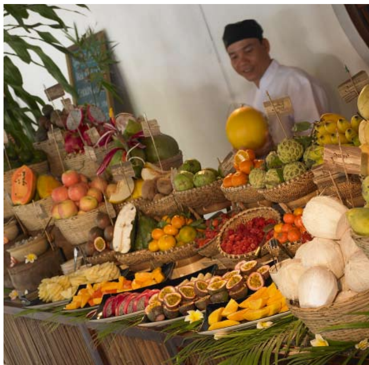
Breakfast - Ana Pavilion Restaurant