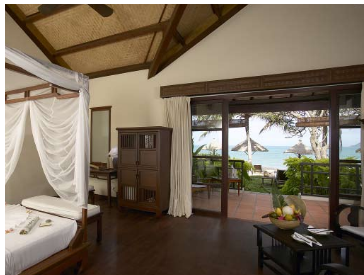
Ana Mandara Suite

Si può scegliere di mangiare all'interno del ristorante o in veranda godendo di una vista spettacolare sulla baia di Nha Trang. Le specialità sono i piatti di cucina vietnamita ed internazionale. Il consiglio è di iniziare la giornata con un'abbondante colazione internazionale a buffet proseguendo poi per pranzo e cena scegliendo direttamente dai menù alla carta.