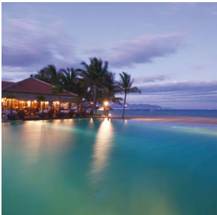
Infinity Pool - Beach Restaurant

E' possibile organizzare attività per i bambini come escursioni di pesca, lezioni di tennis o l'insegnamento dello snorkeling. Qualsiasi attività o escursione può essere sviluppata ad-hoc in base ai desideri di ogni bambino.