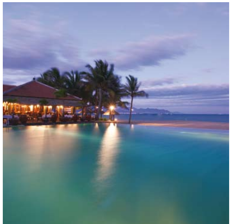
Infinity Pool - Beach Restaurant

Bordeando la playa, entre un cocotero, se encuentra el holístico Six Senses Spa. Su extraordinaria localización y diseño son una referencia gracias a la acertada combinación de colores naturales, elementos hidráulicos y un particular carácter vietnamita. El gran abanico de tratamientos y técnicas tanto orientales como occidentales ofrecidos en el Spa tienen como fin agasajar sus sentidos: cuerpo, belleza y bien estar se dan cita en tratamientos y masajes para equilibrar cuerpo y mente. Para los entusiastas del deporte también hay un pequeño gimnasio, donde además se imparten clases de Yoga y Tai-chi.