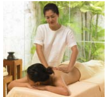
Six Senses Spa

設備豪華的SPA水療區，融合了海灘風情，並建立起SPA服務的新標準設計。這座擁有5座室外的SPA水療按摩亭，每座均以寧靜的蓮花池環繞。室內則設雙人間，和4個單人按摩理療間，2間Saunas熱按摩間，和2間蒸氣浴間。各座建築與設施之間以清澈池塘與綠色草木充實與環繞。