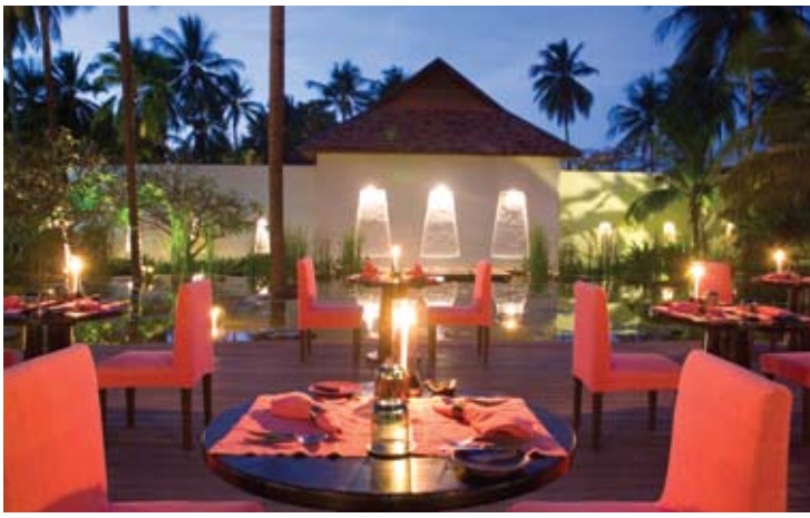
Kieng Sah Restaurant