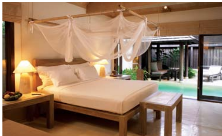
Evasion Pool Villa