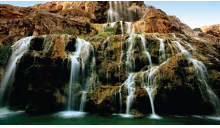
Hot Springs Waterfall