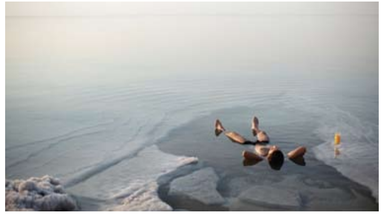
Relaxing at Dead Sea

الأجنحة بغرفة نوم واحدة: تصميم يضم غرفة نوم وحمام وغرفة معيشة منفصلة فيها طاولة ألعاب وبجوارها دورة مياه. كما يوجد أيضاً شرفتان للاستمتاع بالمناظر الخلابة. المساحة: 54 إلى 63 متراً مربعاً.