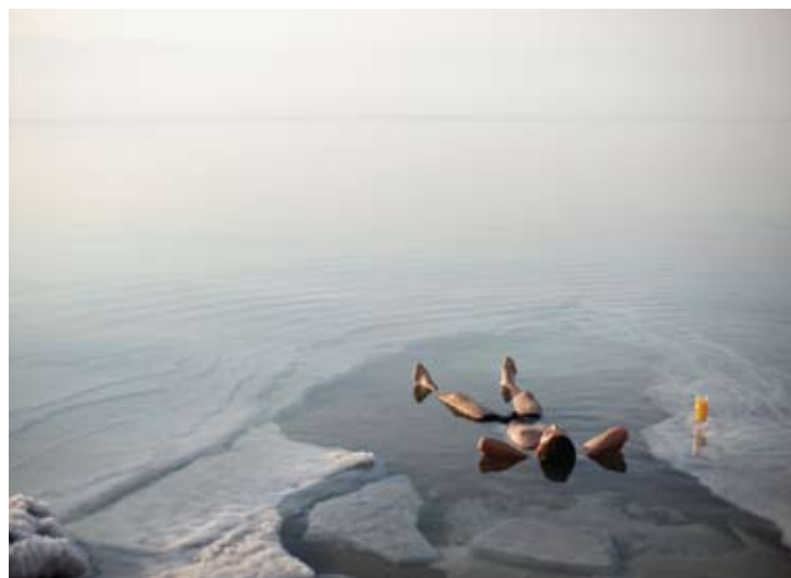
Relaxing at Dead Sea