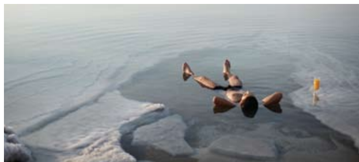
Relaxing at Dead Sea