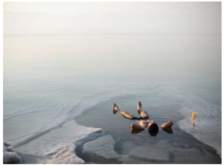
Relaxing at Dead Sea