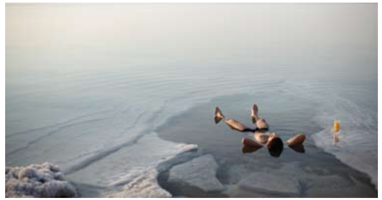
Relaxing at Dead Sea