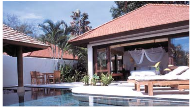
Evason Pool Villa

تضمن الخدمة في إيفاسون اهتماماً كبيراً بالتفاصيل وإيجاد جو من الألفة والود. كما أن ما يميز إيفاسون عن غيره من المنتجعات الكبرى هو أسلوب تقديم تلك الخدمات.