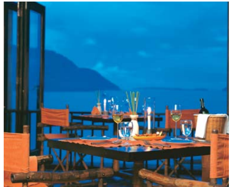
Into The View

أصبح جناح صانديك منتجعات ضمن المنتجع. فهو يشتمل على 16 جناحاً ذا طابقين و10 أجنحة جونيور، وجميعها تتميز بإطلالة ذات مناظر خلابة، إضافة لتوفير خدمة الخادم الشخصي. وهي تعتبر مثالية للعائلات والأصدقاء والأزواج على حد سواء. وللجناح قسم استقبال خاص به، ومركز أعمال ومكتبة مزودة بأجهزة الحاسوب. ويمكن لمن يحملون أجهزة الحاسوب الخاصة بهم استخدام وصلات الإنترنت اللاسلكية دون مقابل. وهناك في الجناح مركز لياقة وغرفة بخار وساونا ومقهى وبار في بركة السباحة، ونادي للأطفال فقط، الخاص بالفتيان. كما يتوفر لهم أيضاً "إنتو جيمز" المجهز بطاولة سنوكر وكرة الطاولة وطاولات كرة القدم، إضافة إلى ألعاب بلاي ستيشن وغيرها.