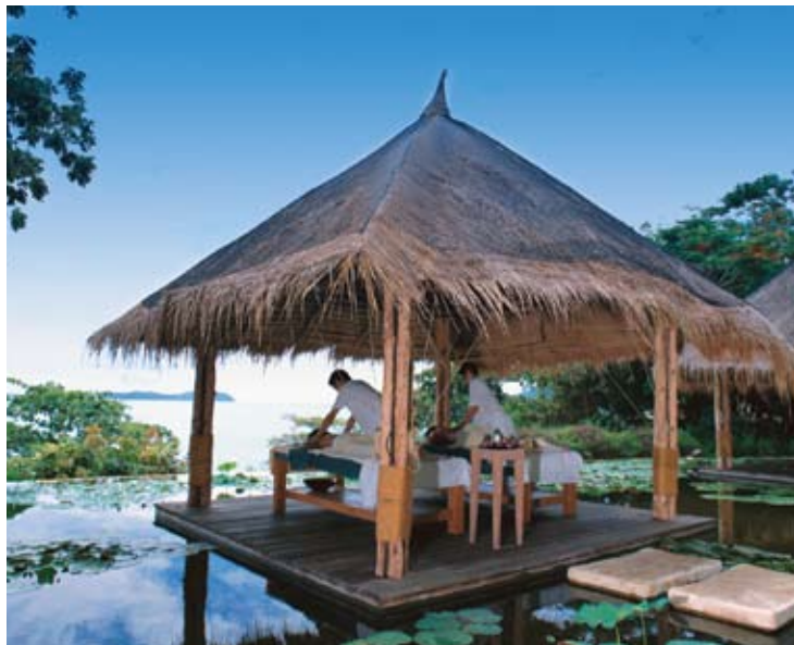
Six Senses Spa

Into Pondering - Situé dans le lobby près d'un ravissant bassin de lotus, le lobby Lounge est idéal pour prendre un en-cas.