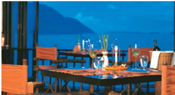
Into The View

1 Evason Honeymoon Suite (115 m 2 ) sur l'île privée de Bon Island : Pour ceux qui rêvent de passer leur lune de miel sur une île déserte, la suite Evason Honeymoon est idéale ! Posée en haut d'une colline face à la mer, la suite se situe sur Bon Island, une île privée appartenant à l'hôtel, qui se rejoint en bateau en 15 minutes.