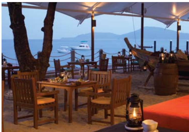
Into The Beach

Bon Island peut être entièrement privatisée, mais elle est accessible à tous les clients de l'hôtel. L'île est aménagée d'un restaurant, d'un bar de plage, d'un centre nautique avec douches et vestiaires. Sur la plage se trouvent 80 transats équipés de parasols et serviettes de bains et 10 « Salas » avec douches privées, des lits de repos avec mini bars et même le téléphone.