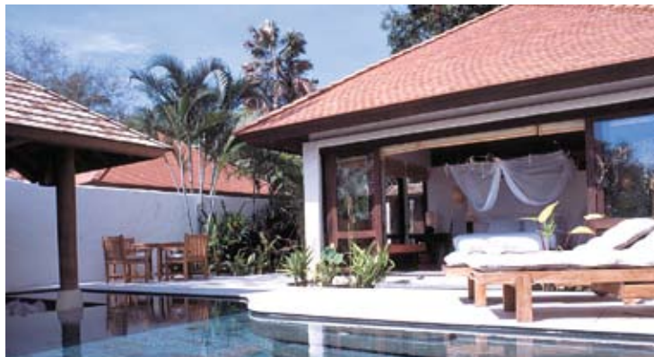
Evason Pool Villa