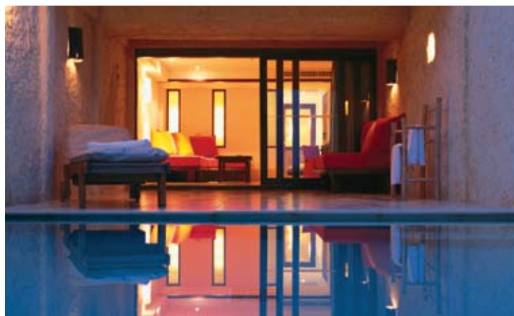
Evason Duplex Pool Suites

La nouvelle aile du côté du ponton comprend 16 Duplex Pool Suites avec service de majordome, idéal pour les familles et amis voyageant ensemble. Cette aile a sa propre réception, son business center et sa bibliothèque équipée d'ordinateurs, et d'un accès wifi gratuit. On compte également un centre fitness, un hammam et sauna, un bar de piscine, un café et club pour enfants Just Kids.