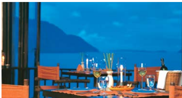
Into The View

Lage: Am Strand, Meerseite untere Etage Öffnungszeiten: 11:00 Uhr – 22:30 Uhr (das Restaurant) bis 01:00 Uhr (die Bar) Sitzplätze: ca. 80 Personen Größe: ca. 180 m 2