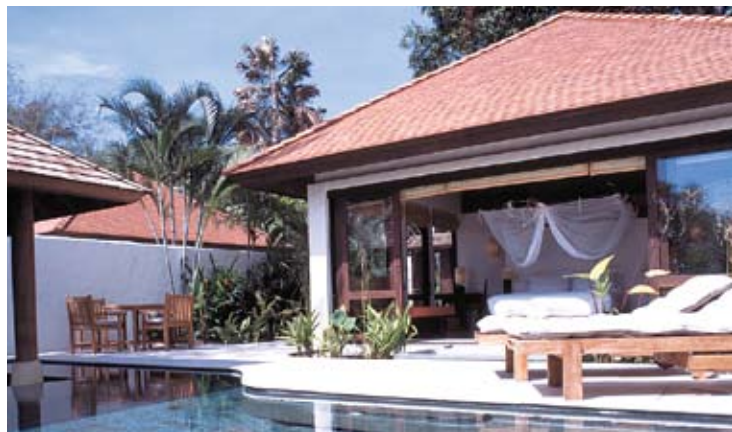
Evason Pool Villa

Einige Evason Duplex Pool Suiten haben eine Badewanne im Außenbereich mit Privatsphäre. Die Suiten auf den unteren Stockwerken verfügen stattdessen über einen privaten Pool.