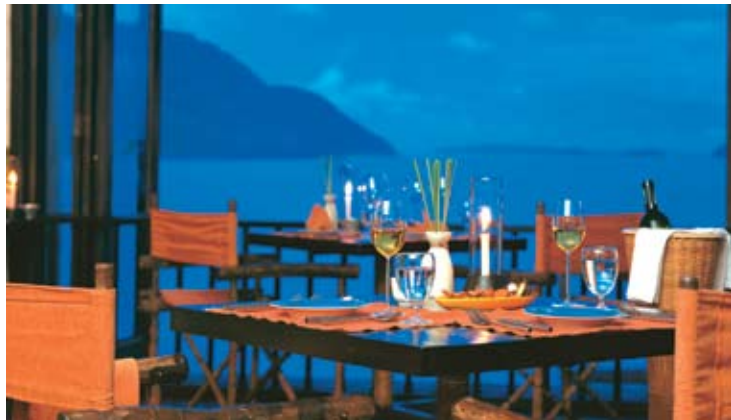
Into The View Restaurant

ボートで15分のボン島にあり、独特の風景が楽しめます。豊富なタイ料理、サラダ、サンドイッチ、ピザなど、お手軽なお料理をくつろいだ雰囲気です。ご要望に応じて、ビーチサイドや10棟ある東屋(1日レンタル)へテイクアウトもできます。ビーチ・レストランはランチタイムのみ営業ですが、宴会やプライベート・ディナーのご予約も可能です。 - 立地: リゾートから15分 - 座席数: 80 席 - 営業時間: 午前9:00 - 午後5:00 - その他: スポーツ、レクリエーション・アクティビティもご用意しています。 島には電話回線が有り、エヴァソン・ブーケットのプライベートアイランドです。