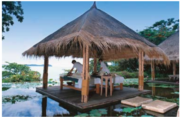
Six Senses Spa

ホリスティックなシックスセンススパでは心身ともにリラックスした、甦らせるトリートメントを提供しています。健康、リラクゼーション、美容、忙しい毎日からのストレス軽減・回復など、満足のいく治療法を体験いただけます。他にはない幅広いスパメニューに加え、常駐セラピストがハーブ療法を駆使し、お客様の美容と健康、心身のバランスを取り戻すよう、アドバイスいたします。