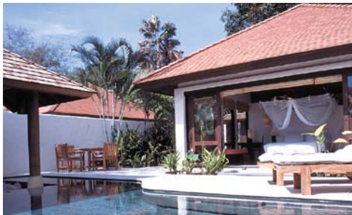
Evason Pool Villa