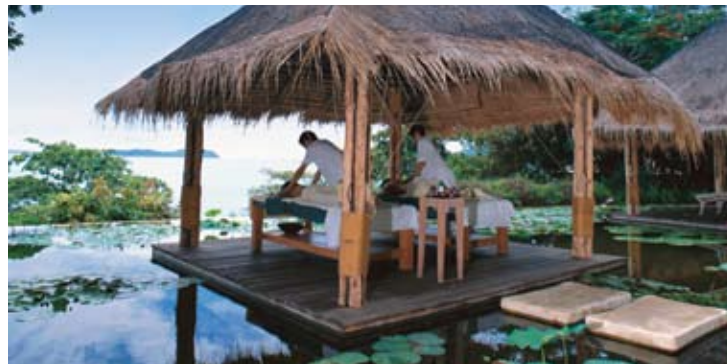
Six Senses Spa

В лобби у главного входа располагается винный погреб, в котором стоит специальный деревянный стол для дегустации вин в сопровождении легких закусок. Также здесь можно проводить небольшие мероприятия. Изюминка винного погреба в том, что через стеклянную дверь видно все, что происходит внутри!