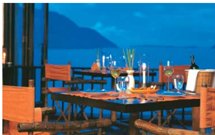
Restaurante Into The View