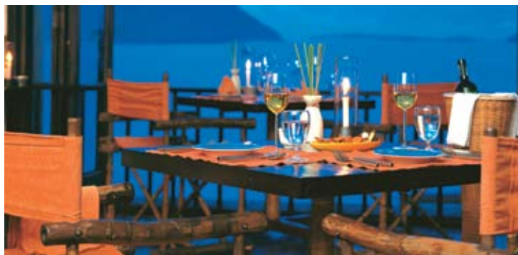
Restaurante Into The View