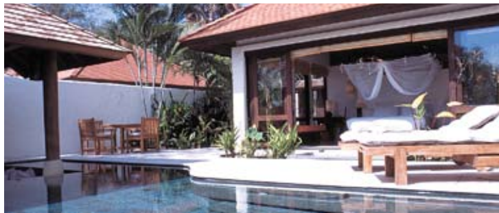
Evason Pool Villa

centro de entretenimiento "Into Games" es ideal para jóvenes y cuenta con mesa de pool, fútbolín, mesa de ping-pong, play station y otros muchos juegos. También hay Wi-fi disponible en "Into Pondering" y en "Into the Beach".