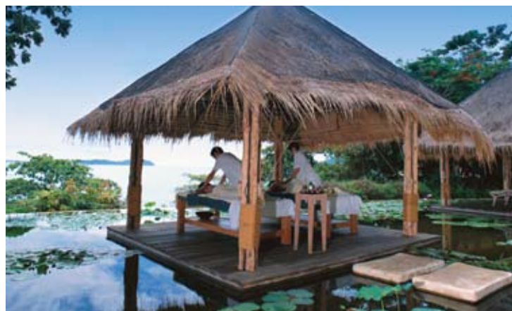
Six Senses Spa

Nuestro holístico spa Six Senses es más que un simple de capricho. Es una experiencia relajante y revitalizante, además de beneficiosa para la salud. Nuestro lujoso spa se despliega en tres pisos y es un referente de diseño en balnearios. Las instalaciones cuentan con 6 salas de tratamiento individuales, 2 saunas, 2 baños turcos y 3 salas de tratamiento dobles con baños en el exterior para disfrutar en pareja o entre amigos. Existen también 4 salas adicionales en la terraza con vistas al mar.