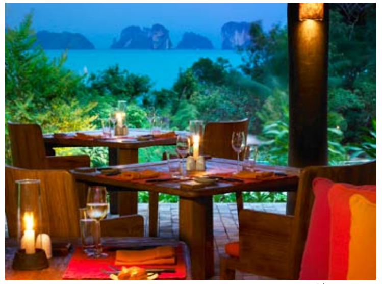
The Living Room