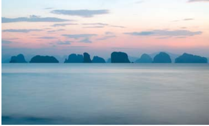
Phang Nga Bay