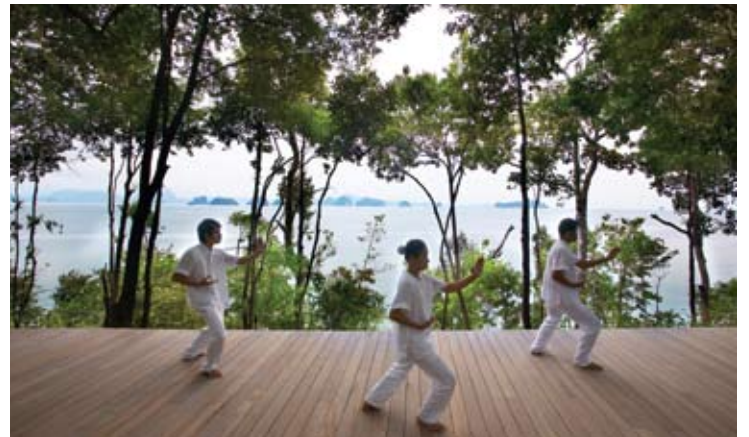
Qi Gong platform