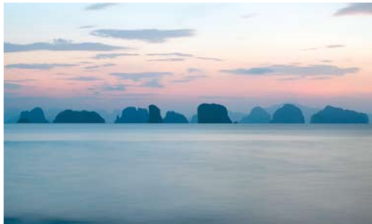
Phang Nga Bay

Six Senses Hideaway Yao Noi si trova sull'isola di Yao Noi, situata a metà tra Phuket e Krabi, tra le cime dei suggestivi faraglioni, chiamati "Limestone", nella rinomata baia di Phang Nga. Raggiungibile dall'aeroporto in circa 45 minuti di barca.