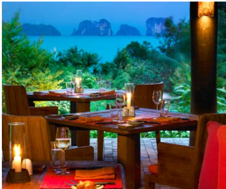
The Living Room