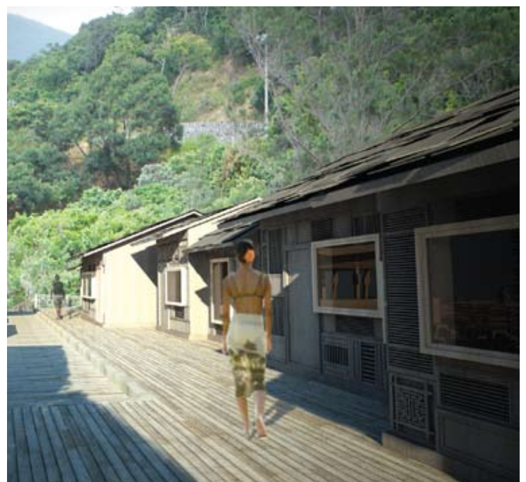
The Market Area