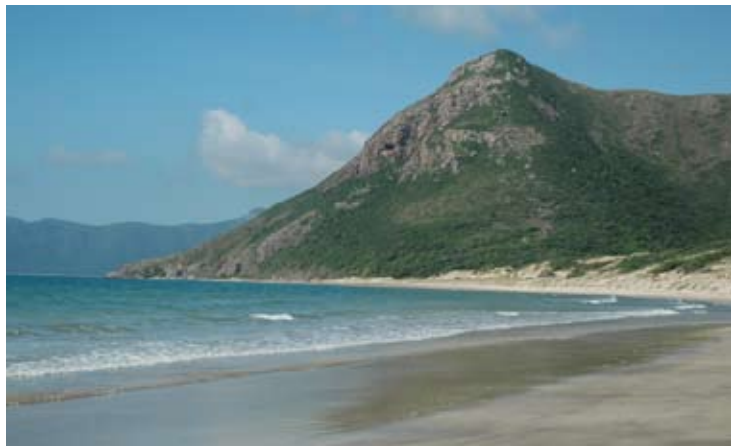
Con Dao Island