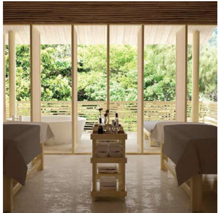
Six Senses Spa Treatment Room

Dentro de esta replica de poblado rural Vietnamita, provisto de su calle principal y su típica plaza, se encuentra este particular mercado. Las tradicionales casitas exhiben su artesanía local y cuentan además con un taller de carpintería y una Galería Six Senses. Las terrazas entre la biblioteca y el bar invitan al visitante a disfrutar del panorama a la par que de las variedades gastronómicas disponibles.