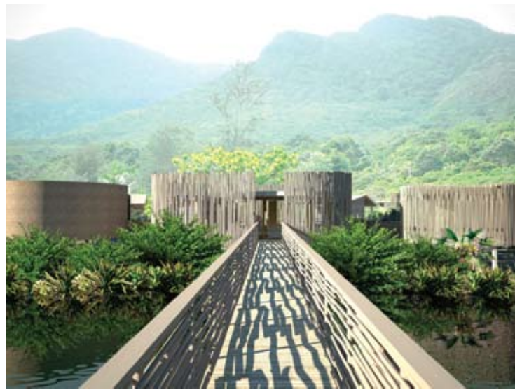
Six Senses Spa