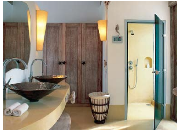
Pool Villa Suite Master Bathroom