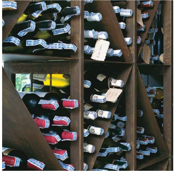
The Wine Cellar

ضمن الخدمات والتسهيلات الأخرى التي يوفرها المنتجع هو سبيكس سينسز سبا الحاصل على عدة جوائز، مع أماكن داخلية وأخرى في الهواء الطلق. يركز سبيكس سينسز سبا على تحقيق تجربة وجدانية متكاملة عن طريق توفير برامج علاجية، البعض منها مصمم للأزواج.