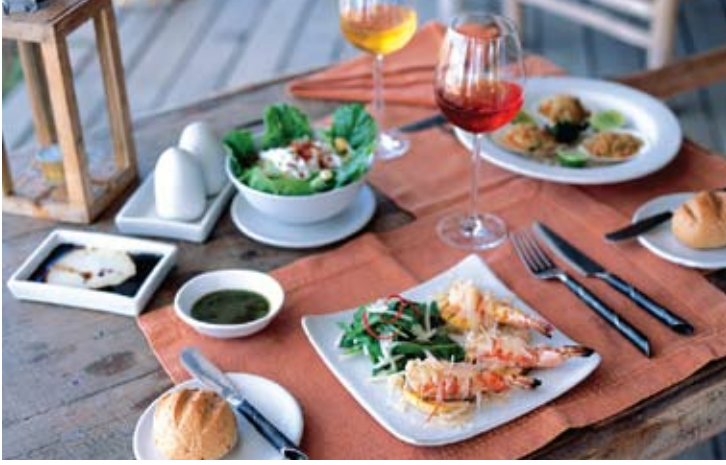
The Beach Restaurant

نوفر لضيوفنا خيار التمتع بتجربة لا تنسى عند تناولهم الطعام على شرفتهم الخاصة. للضيوف الرومانسي، نستطيع إعداد إفطار شامباتيا على الشرفة. كخيار بديل، يمكن تحضير عشاء نوهة أو غداءً فاحراً يقدم في حديقة الضيف الخاصة. لتجربة تناول طعام فريدة، يمكن إعداد عشاء شواء تحت النجوم في فيلا الضيف الخاصة مع طاهي ونادل خاص.