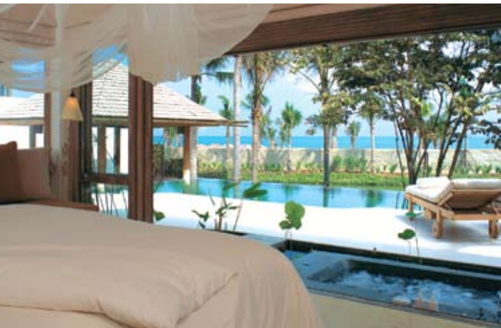
Pool Villa Suite Sea Facing

ذي بيتش هو مطعم مفتوح، يوفر مشاهد تطل على خليج سيام . مطبخ المطعم مفتوح على غرفة الطعام مع فرن يعمل على الخشب على الطريقة التقليدية . يقدم المطعم أجود الخيارات من مأكولات البحر المتوسط والمأكولات البحرية المحلية والسلطات الخفيفة الصحية التي تقدم بأسلوب بعيد عن الرسمية لكنه معاصر . يقدم المطعم وجبات الغداء والعشاء فقط .