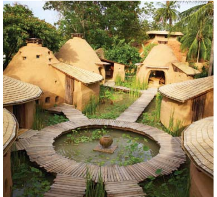
The Earth Spa

ذي إيرث سبا يقدم قائمة شاملة من المعالجات المتخصصة التي تركز على تغذية البشرة. برنامج غذاء البشرة يعبر عن الإيمان الراسخ بأنه لا يجب وضع أي شيء على البشرة عدا المنتجات الطبيعية التي تصلح للأكل. وللتوازن التام، يركز المنتجع على الطب التقليدي الشعبي مثل الطب الصيني والأيورفيدا. تتم زراعة العديد من المنتجات والمكونات المستخدمة في المعالجة في منتجع سبيكس سينسز هايداواي نفسه. بعض المنتجات التي يتم زراعتها وحصادها بشكل مستمر هي: الأرز، جوز الهند، الأفوكادو، البابايا، الليمون، الصبار، الخيار، عشبة الليمون، ورق البندانوس، الزنجبيل، الغالانغال، الكاندلنت، والكركم.