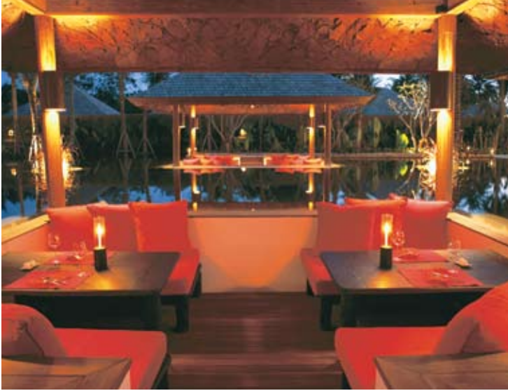
Sunken Sala Living Room Restaurant

بجانب ذي ليفينغ روم، يقدم ذي واين سيلار خليطاً من اجود أنواع النبيذ الجديدة والكلاسيكية لتوفر للضيف فرصة الاستمتاع التام بوجبات الطعام. تغطي لائحة النبيذ العديد من مناطق صناعة النبيذ المعروفة والجديدة من مختلف أنحاء الكرة الأرضية.