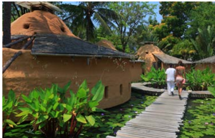
Six Senses Earth Spa at Hua Hin