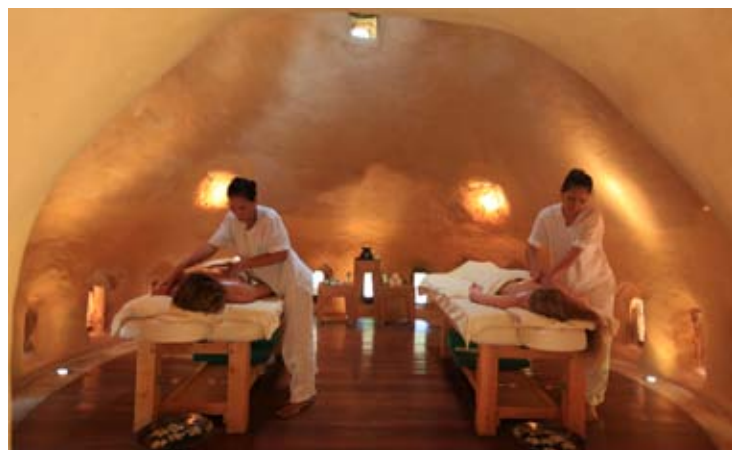
Six Senses Earth Spa at Hua Hin - Treatment Room

The Earth Spa bietet eine umfassende Auswahl an Spezialbehandlungen mit dem Schwerpunkt auf Skin Food – Die Verpflichtung die Haut ausschließlich mit qualitativ hochwertigen Nahrungsmitteln zu behandeln. Im Gleichgewicht zu diesen Elementen stehen die Philosophien der traditionellen Medizin, unter anderem der Chinesischen und der Ayurvedischen. Viele der verwendeten Zutaten wachsen direkt im Garten des Six Senses Hua Hin und werden dort frisch geerntet. Diese beinhalten Reis, Kokosnuss, Avocado, Papaya, Limette, Aloe Vera, Gurke, Pandanus, Zitronengras, Ingwer, Galangal, Candelnut und Turmeric.