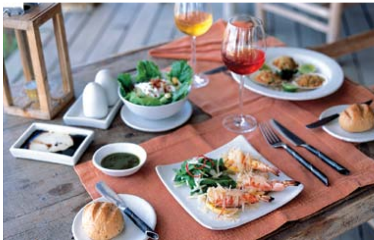
The Beach Restaurant