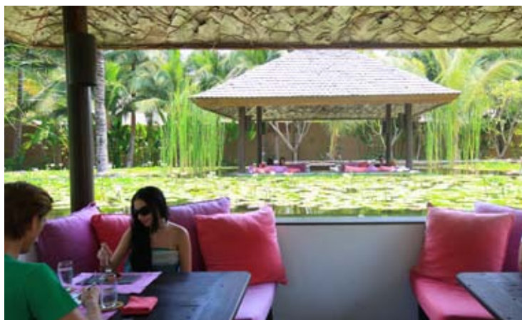
Living Room Restaurant - Sunken Sala