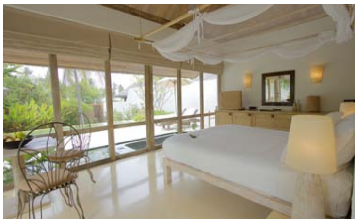
Six Senses Pool Villa