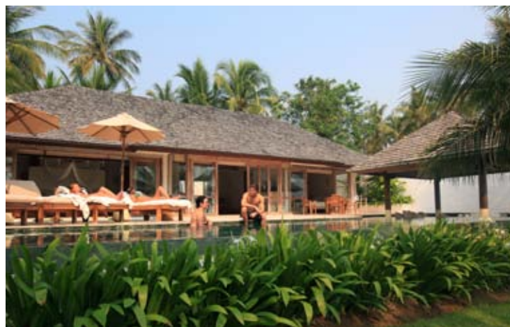
2 Bedroom Seaview Pool Villa Suite