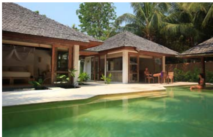
Pool Villa Suite