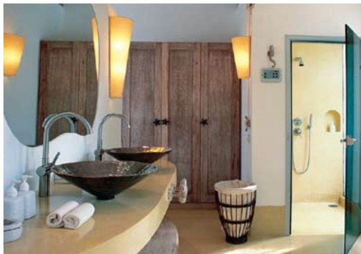
Pool Villa Suite Master Bathroom