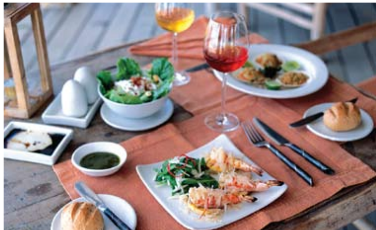
The Beach Restaurant

Indimenticabile esperienza: cenare nella privacy della propria villa. Per i veri romantici è possibile organizzare un "Champagne breakfast" in terrazza. In alternativa, si organizzano picnic o sontuose feste nel giardino delle ville. Per qualcosa di particolare, "Villa BBQ dinner", cena sotto le stelle con a disposizione uno chef privato ed un cameriere.