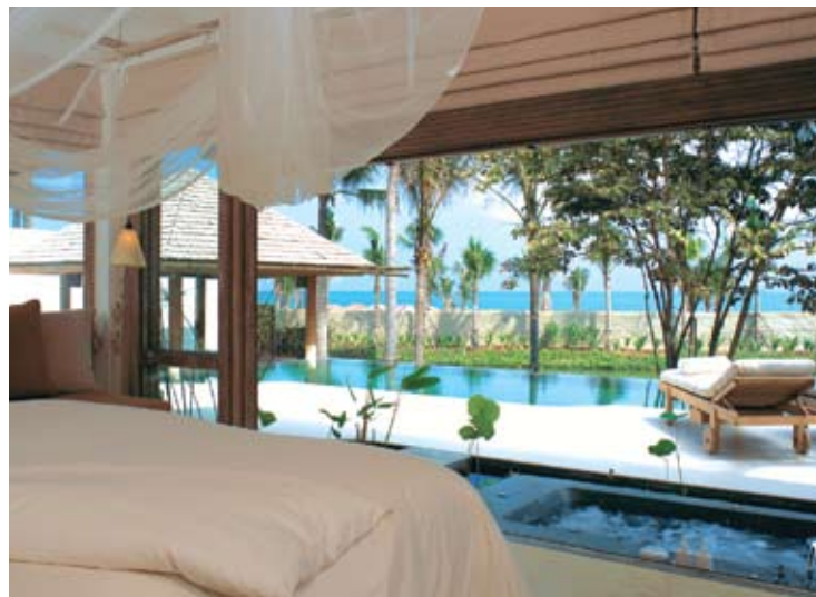
Pool Villa Suite Sea Facing