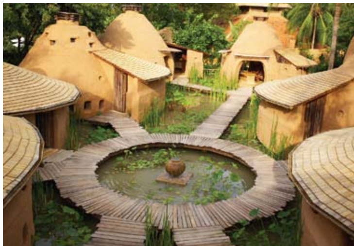
Six Senses Earth Spa at Hua Hin

Il Club "The Evason Just Kids!" è il luogo ideale per i bambini che permette ai genitori di passare del tempo da soli, nella certezza che i loro figli siano in buone mani.