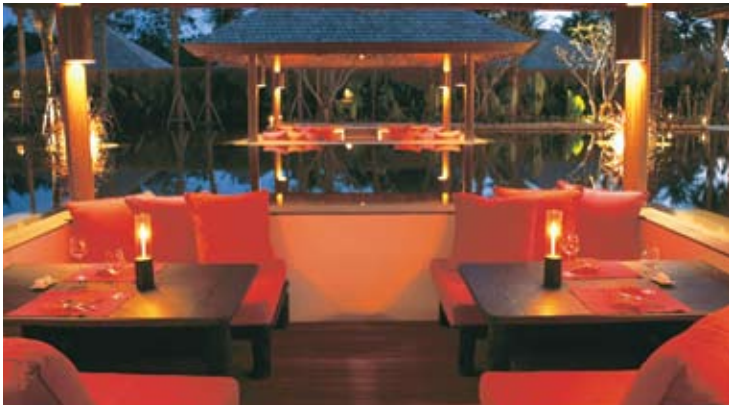
Sunken Sala Living Room Restaurant

전용 빌라 테라스에서 즐기는 은밀한 다이닝이라는 잊지 못할 경험을 식스센스 하이더어웨이 리조트에서 하실 수 있습니다. 진정한 로맨틱한 무드를 위해서, 샴페인 조식을 빌라 테라스로 배달해 드리기도 합니다. 좀더 특이한 중식을 즐기거나 할 경우, 피크닉 런치나 화려한 음식의 향연이 투숙객의 가든에서 마련되기도 합니다. 좀더 색다른 빌라 다이닝을 원한다면, 별 아래서 즐기는 빌라 BBQ 디너가 좀 더 새로운 의미를 선사해 드릴 것입니다. 빌라 BBQ 디너는 전용 요리사와 웨이터가 직접 준비하여 서빙합니다.