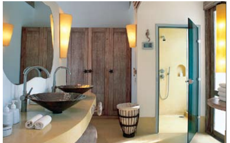
Pool Villa Suite Master Bathroom