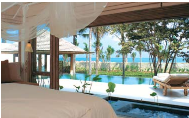
Pool Villa Suite Sea Facing

И нас в «Six Senses Hideaway Hua Hin» мы горды не только качеством приготовляемой пищи и уровнем сервиса, но еще и самой атмосферой, сопровождающей время ужина. Здесь мы можем предложить ужин на открытом воздухе, романтический и уникальный. Завтрак в комфорте вашей виллы или обед в ресторане на пляже с таким же изысканным видом, как и изысканна наша кухня.