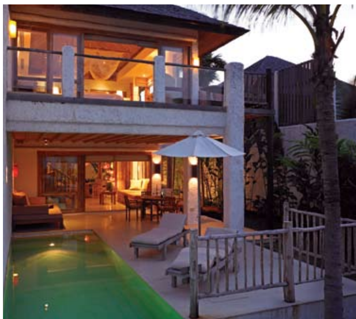
Duplex Pool Suite

«Six Senses Earth Spa» предлагает богатый перечень процедур с концентрацией на питании кожи, с идеей, что в кожу не нужно добавлять ничего, что не может быть съедено. Все процедуры производятся в соответствии с философией традиционной медицины - древней китайской и Аюрведы. Многие ингредиенты выращиваются непосредственно на огородах и садах «Six Senses Hideaway»: рис, кокос, авокадо, папая, лайм, алоэ, огурцы, пандан, лимонная трава, кориандр, куркума и другие, здоровые и прямо с корня.