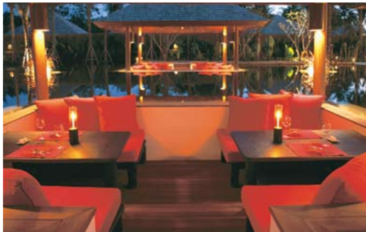
Sunken Sala Living Room Restaurant

Открытый ресторан «The Living Room» на берегу пруда для тех, кто любит отужинать под шелест листьев и тропического бриза. «The Living Room» - стильный, но не слишком формальный ресторан, в котором специализируются на международной кухне из самых свежих продуктов, с ежедневно обновляющимся меню закусок. Ресторан открыт на завтрак и ужин.