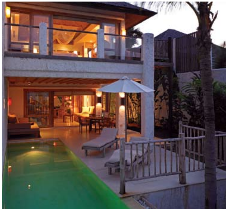
Duplex Pool Suite

第六感觉海德威度假村还拥有其他的服务与完善设施，包括获得优秀奖的“第六感觉水吧”（Six Senses Spa）。包括了室内与室外休闲活动区，并专业提供包罗万象的芳香健康疗法服务，包括特别的理疗设计以产生关联的舒适愉快感。这里设有1座室内运动场、水上运动娱乐中心、DVD图书馆以及别墅内的娱乐系统，并设有1座“第六感觉精品店”（Six Senses Gallery gift shop）。该中心内还设有网球场和水上运动区。