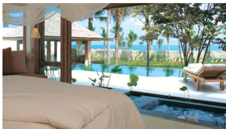
Pool Villa Suite Sea Facing