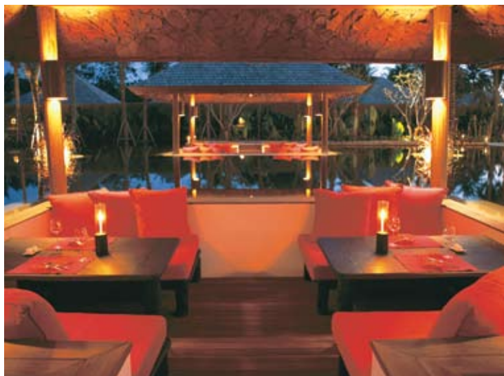
Sunken Sala Living Room Restaurant

对于喜爱在温柔热带气候下享受晚餐环境的顾客，备有客厅 Al fresco 露天式晚餐服务，可边用餐边欣赏宁静的莲池。客厅的设计风格，融合了西方风味与泰式餐饮的浓郁特色，所选用的烹调材料注重新鲜，每天都变换新式样的桌上菜单供您选择，同时设有全天菜谱，可供应早餐和晚餐。