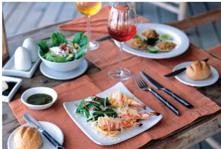
The Beach Restaurant

第六感觉海德威度假村的愉快心情令人难忘，该餐厅设独立阳台间，营造浪漫晚餐气氛。或组织一场香槟早餐，直接呈送到阳台。午餐也有多项选择，一个露营式野餐或者豪华盛宴，也可在顾客的花园内举行。晚餐也别具一格，可点 Villa BBQ 露天烧烤，享受星光下的晚宴气氛，专为您服务的厨师及服务生，直接提供殷情服务。