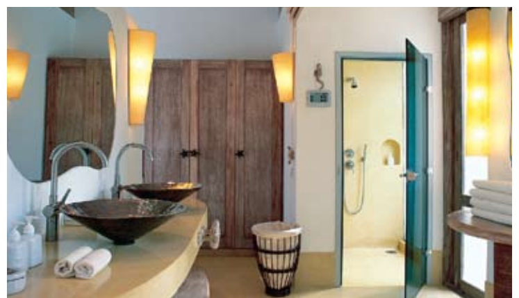
Pool Villa Suite Master Bathroom

顾客在海德威度假村可以有多种服务选择，例如可在邻近的华欣爱梵森别墅村，也可享受各类特权服务，增添愉快记忆。