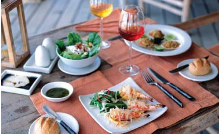
The Beach Restaurant

Las íntimas cenas en la terraza de su villa componen esta inolvidable experiencia del Six Senses Hideaway. Para los románticos empedernidos, existe la posibilidad de reservar un "desayuno de champán" en su terraza. Otras alternativas son los picnics o banquetes en el jardín de su villa. El toque diferente lo ponen las barbacoas en su villa, especialmente si supone cenar bajo las estrellas. En estos casos se pone a disposición del cliente un chef y un camarero para los servicios.