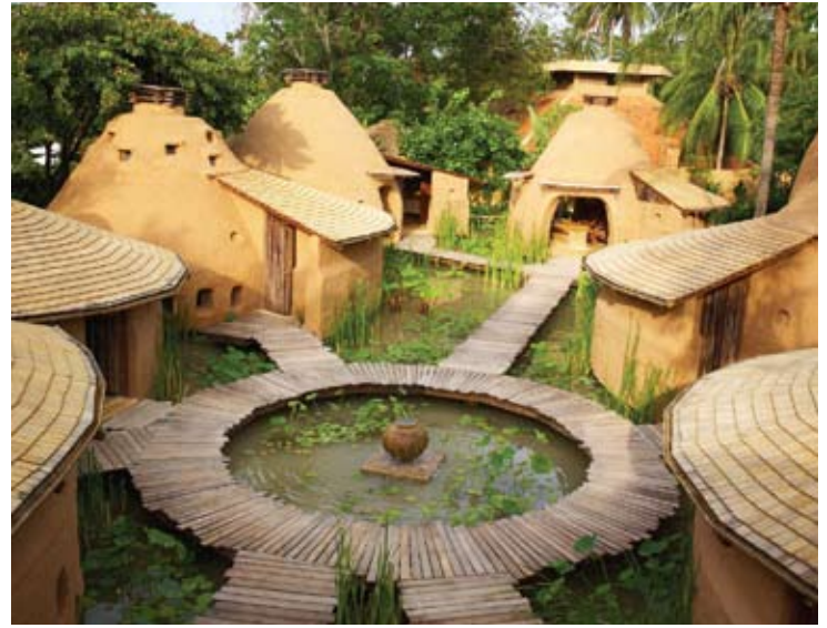
Six Senses Earth Spa at Hua Hin

El club infantil "Just Kids!" permite a las parejas disfrutar de algo de tiempo a solas con la confianza de haber dejado a sus hijos en manos de profesionales.