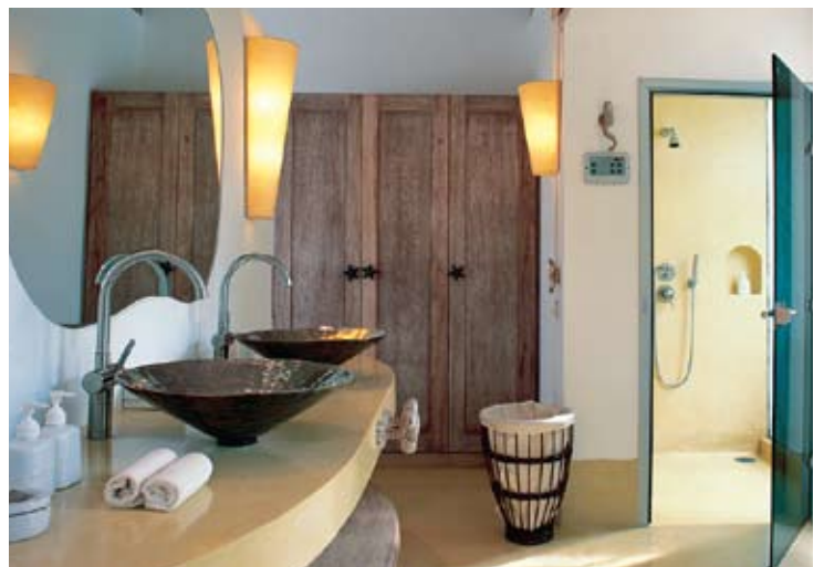
Pool Villa Suite Master Bathroom