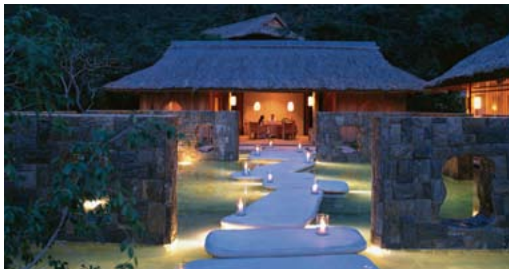
Six Senses Spa