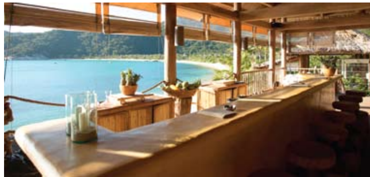
Drinks by the Bay