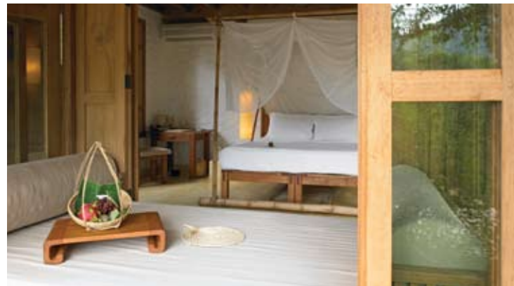
Beach Villa Schlafzimmer