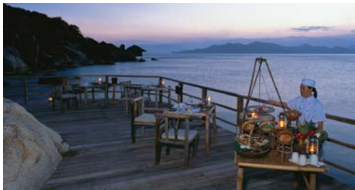
Dining by the Bay

Das Frühstücksbuffet, das ebenfalls hier serviert wird, erfüllt mit frischen tropischen Früchten und einer großen Auswahl an asiatischen und westlichen Speisen alle Frühstückswünsche. Das Restaurant dehnt sich über zwei Ebenen mit freier Sicht über die Bucht und einer leichten Brise, die die Sinne weckt. Das Ambiente in der unteren Ebene ist lauschig mit Bambusdach während es im oberen Bereich durch hohe Decken und einem Palmendach glänzt und ein Gefühl des Essens im Freien vermittelt.