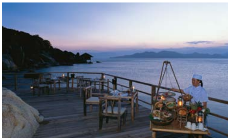
Dining by the Bay