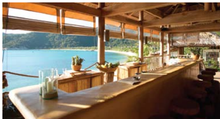
Drinks by the Bay

Dining by the Rocks offre un'ambientazione intima e raccolta, che guarda verso la baia ed è servita da sei portate da abbinare alla selezione di vini approntata personalmente dallo Chef. I piatti sono preparati anche davanti ai commensali nella cucina a vista, dalle ore 19.00 fino alle ore 22.30. Sono disponibili circa 12 posti a sedere sulla terrazza che offre una vista mozzafiato su Ninh Van Bay, verso le montagne imponenti e verso Nha Trang. Scopritelo uno stile gastronomico esemplare che renderà l'esperienza di per sé ineguagliabile.