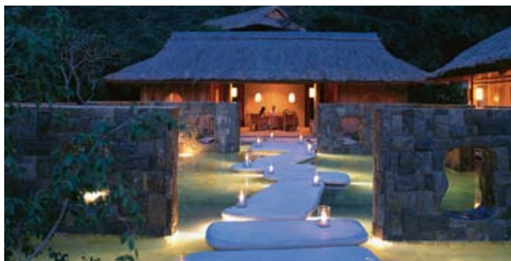
Six Senses Spa