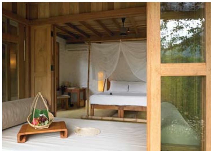
Beach Villa Bedroom