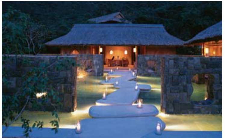
Six Senses Spa