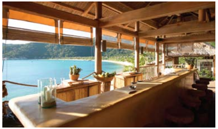
Drinks by the Bay

다이닝 바이더 베이에 인접한 곳에 위치한 드링크 바이더 베이에서는 일몰을 바라보면서 저녁 식사 전 반주를 즐기실 수 있습니다. 저녁 식사 후 편안한 소화를 촉진시키는데 이상적인 장소이기도 합니다. 이 바는 마지막 손님이 잠자리로 떠날때 까지 오픈합니다.