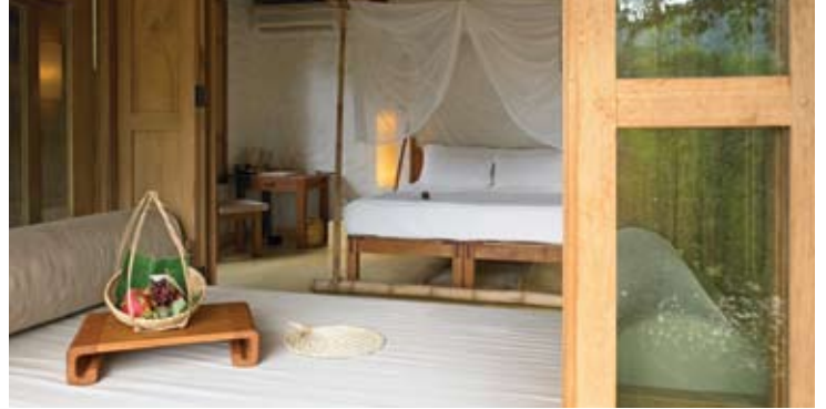
Beach Villa Bedroom