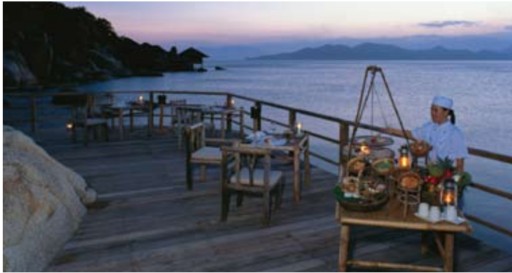
Dining by the Bay

다이닝 바이 더 베이 레스토랑은 인터네셔널 퓨전 요리 뿐만 아니라 로컬 요리를 저녁에 선보입니다. 아침 뷔페 식사도 이곳에서 제공되며 다양한 종류의 아시아 및 웨스턴 조식, 신선한 열대 과일이 제공됩니다. 이 레스토랑은 감각을 새롭게 하는 부드러운 산들바람이 불어오는 만이 바라다 보이는 시원하게 트인 2개의 층으로 이루어져 있습니다. 아래층의 분위기는 대나무 지붕이 있는 편안한 분위기라면, 2층은 야자나무잎으로 엮어 세운 높은 지붕이 있어, '야외' 식사 분위기를 제공해 드립니다