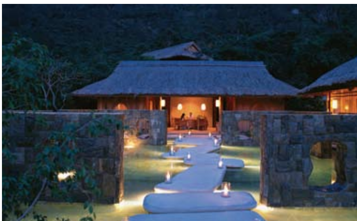
Six Senses Spa