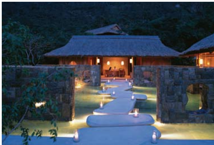
Six Senses Spa