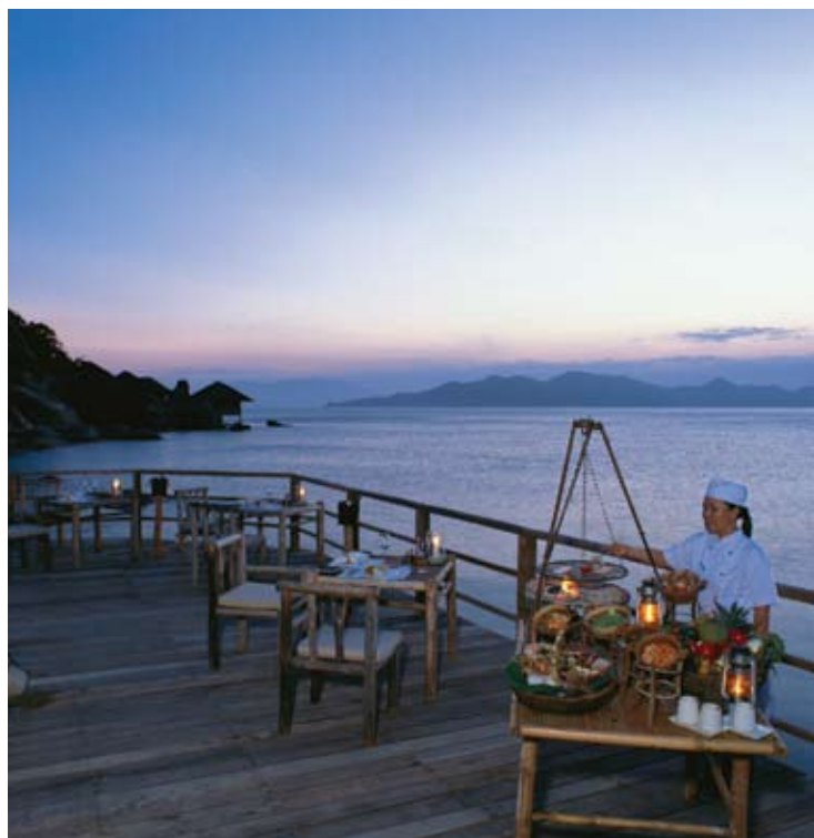
Dining by the Bay