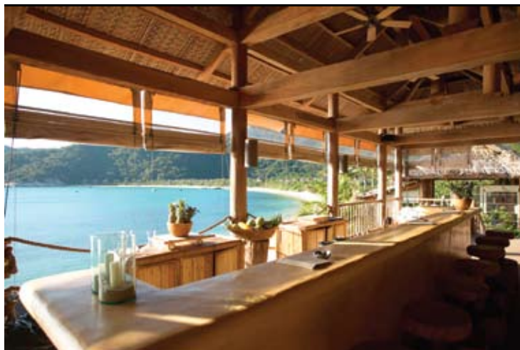
Drinks by the Bay