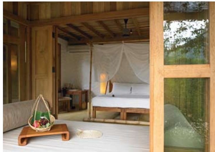
Beach Villa Bedroom