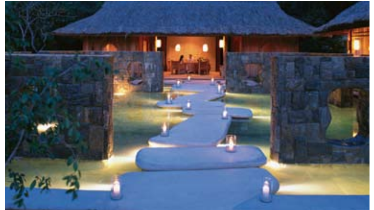
Six Senses Spa