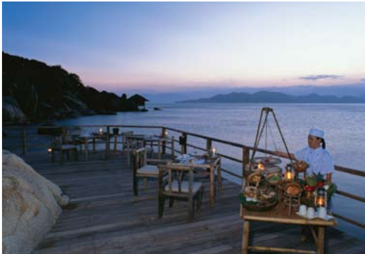
Restaurante "Dining by the Bay"

Por las noches, el restaurante "Dining by the bay" sirve platos de fusión y platos típicos de la región. El buffet de desayunos se sirve también en este restaurante e incluye una gran variedad de platos asiáticos y occidentales y una selección de refrescantes frutas tropicales. El restaurante se yerge sobre dos niveles con excelentes vistas a la bahía y una suave brisa marina que refresca los sentidos. El ambiente acogedor del nivel inferior se consigue gracias a su techado en bambú mientras que en el nivel superior destaca el alto techo de paja y la experiencia de cenar al aire libre.