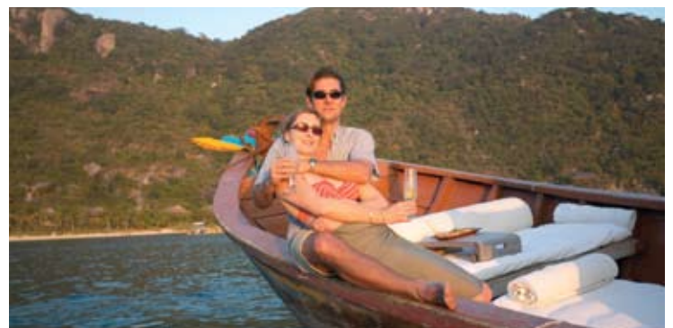
Cena en crucero

Se pueden reservar excursiones al Vietnam continental con guías experimentados. Visite los lugares de interés, haga compras en los mercados de Nha Trang o explore el Vietnam más tradicional visitando las zonas rurales.