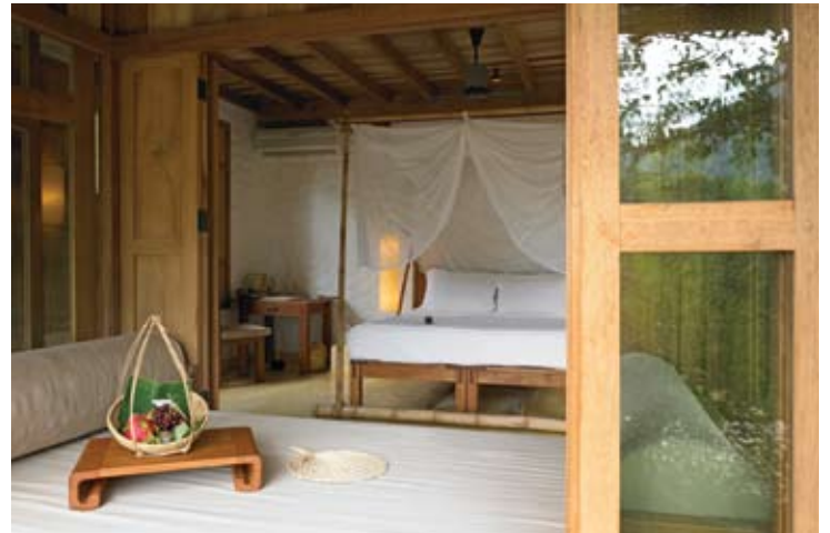
Beach Villa Bedroom