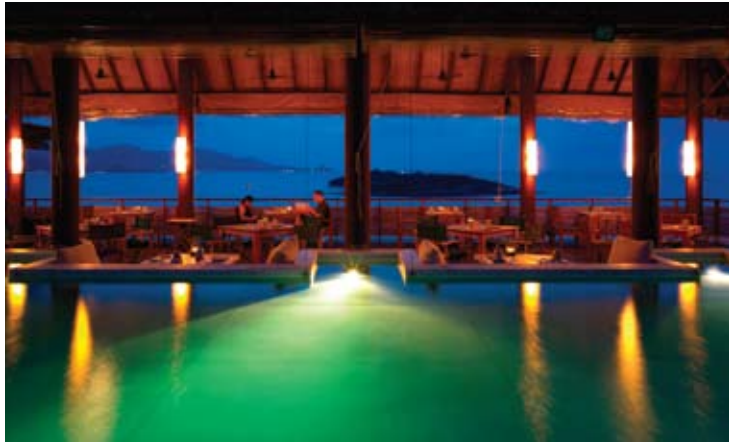
Dining on the Hill