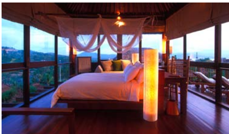
Pool Villa Bedroom