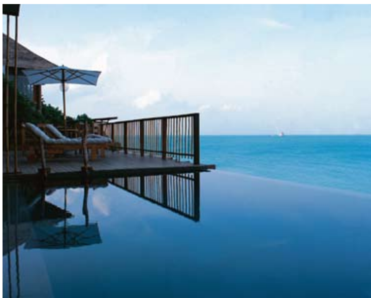
Pool Villa Seaview

Jeder Villa steht ein eigener Butler zur Verfügung, der den Gästen alle Wünsche von den Augen abliest. Dieser Butlerservice ist ein einzigartiges Konzept, das den Gästen von der Ankunft bis zur Abreise das Six Senses Hideaways Konzept „neudefinierte Erlebnis“ beispielhaft erläutert.