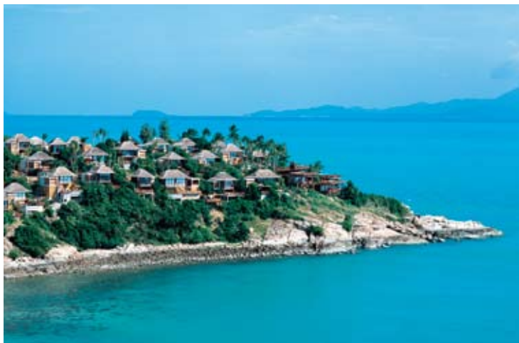
Six Senses Hideaway Samui

Die nur 21 Kilometer breite und 25 Kilometer lange Insel Koh Samui liegt südlich von Bangkok und östlich von Phuket im Golf von Thailand. Regelmäßige Flugverbindungen bestehen von Bangkok, Phuket, Singapur und Hong Kong. Das Wahrzeichen von Koh Samui, der berühmte „Big Buddha“ befindet sich nur ca. fünf Minuten vom Resort entfernt.