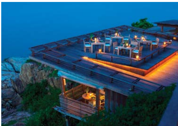
Dining on the Rocks

Für ein privates Abendessen gibt es eine große Auswahl an romantischen Plätzen.