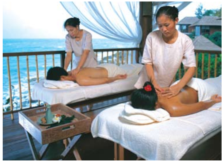
Six Senses Spa