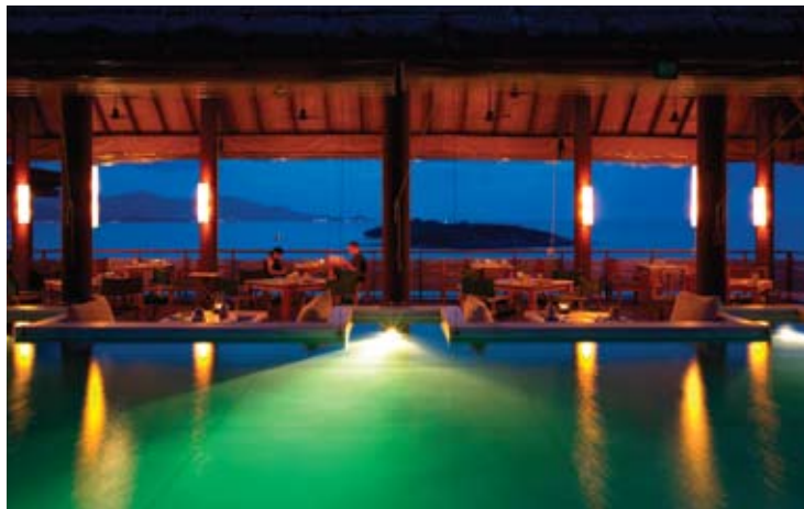
Dining on the Hill

Ресторан Dining on the Hill очень удобно расположен рядом с винными погребами, что позволяет гостям самостоятельно выбрать вино к трапезе.