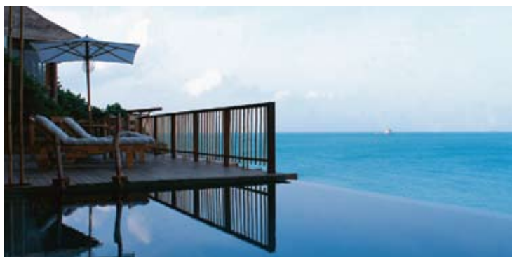
Pool Villa Seaview

* ЭКОЛОГИЧЕСКИЕ ЧИСТОТЫ - ВДОХНОВЕНИЕ - РАЗВЛЕЧЕНИЕ - ВПЕЧАТЛЕНИЕ