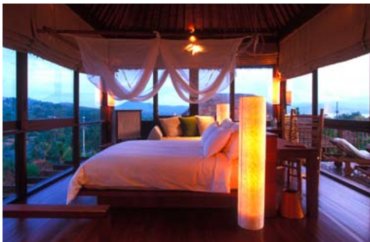
Pool Villa Bedroom