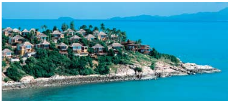
Aerial View of Six Senses Hideaway Samui

Остров Самуи располагается на юге страны в Сиамском заливе. Размер острова 21 километр шириной и 25 километров длиной. Остров доступен внутренним и международным рейсам из Бангкока, Пхукета, Сингапура и Гонконга. Отель расположен в 5 мин. езды от знаменитой статуи Большого Будды.