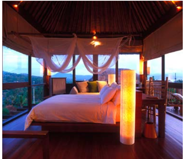
Pool Villa Bedroom