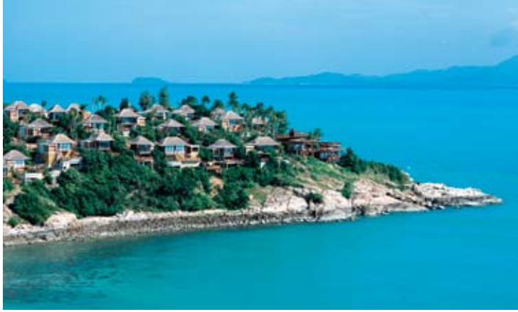
Aerial View of Six Senses Hideaway Samui

苏梅岛是在座落在曼谷与普岛之中间泰国湾海域内的1座观光胜地, 是泰国第三大岛屿, 长25公里, 宽21公里, 并设有从曼谷、普吉、芭堤雅、新加坡和香港的直飞航班。岛上有1座著名的禅座佛像「大佛像」, 距离本酒店仅5分钟的路程。