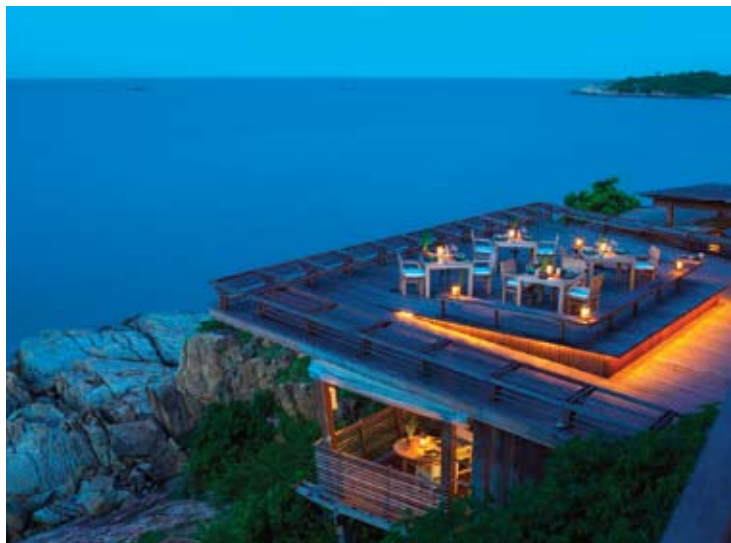
Dinning on the Rocks