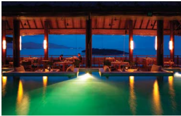
Dinning on the Hill