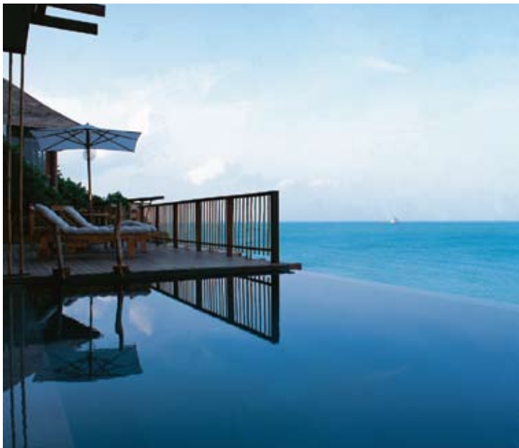
Pool Villa Seaview

管家式的服务风格为所有房客提供最独特美妙的全新享受, 海德威品牌自始至终乐意为您的旅途奉上创意的“重新定义”的美好印象。