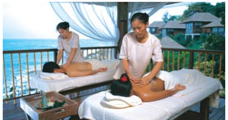
Six Senses Spa

精巧设计的室外SPA按摩亭, 可以最大限度的观赏壮观的海景。另设室内SPA理疗按摩室。第六感觉SPA提供完整的传统水吧疗养服务选择, 由技艺娴熟的SPA理疗师, 配上天然和精心配制的SPA按摩保养品。包括提供全身肌肤美化护理, 以及完整的身心疗护方式, 例如瑜伽功、太极拳、普拉提健身法等。SPA护理的精妙之处在于促进全身心的放松享受, 因此护理过程包括可视见的按摩及肌肤呵护程序, 加以美容美肤服务和健身运动的完美融合。