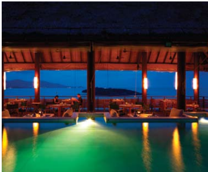
Dining on the Hill