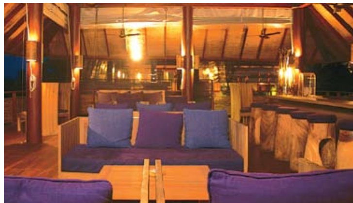
Drinks on the Hill