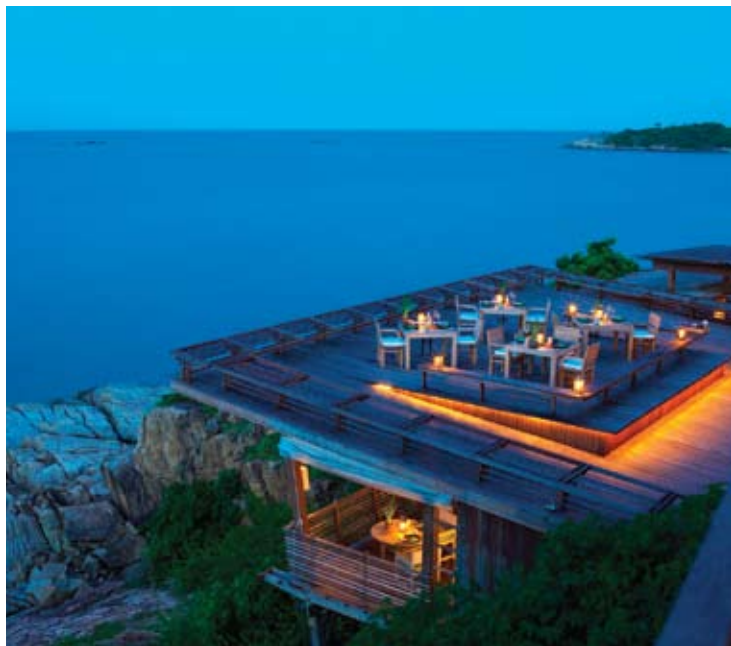
Dining on the Rocks

Este elegante restaurante, abierto para cenar, se encuentra en lo alto del acantilado por lo que dispone de 270° de vistas al mar y a las islas próximas. Está dispuesto en 9 niveles e incluye mesas en reservados y en el tejado, con una gran variedad de estilos. Gracias a su innovador diseño y su vanguardista cocina molecular se ha convertido en el principal destino culinario de Koh Samui. Los viernes, nuestro Chef le acogerá en su mesa para proporcionarle una experiencia culinaria europea sin igual.