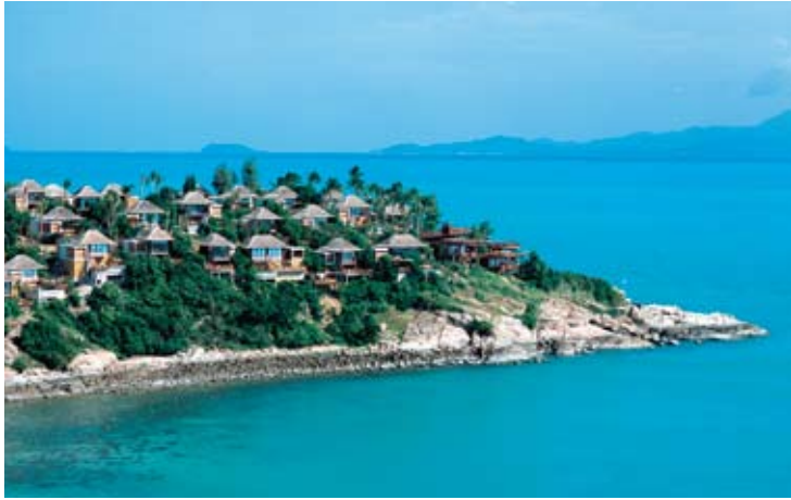
Aerial View of Six Senses Hideaway Samui

El Six Senses Hideaway Samui se encuentra en un acantilado del extremo norte de la Isla de Samui, aproximadamente a seis kilómetros al sur del aeropuerto de Bangkok, trayecto que se realiza en tan solo 45 minutos de avión. Se encuentra rodeado por 20 acres de frondosa vegetación tropical con panorámicas vistas al Golfo de Siam y las islas periféricas. Koh Samui está en el Golfo de Tailandia, al sur de Bangkok y al este de Phuket. La isla sólo tiene 21 metros de diámetro y 25 de longitud pero cuenta con frecuentes vuelos a Bangkok, Phuket, Singapur y Hong Kong. La enorme efígie del Buda sentado, más conocida como el "Gran Buda" está a tan solo 5 minutos del resort.