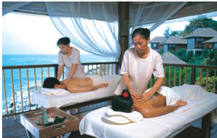
Six Senses Spa

Como en todos los resorts de Six Senses, la bodega cuenta con más de 300 marcas de vino provenientes de 19 países. Se realizan con asiduidad catas y cenas vinícolas en compañía de nuestro sumiller.