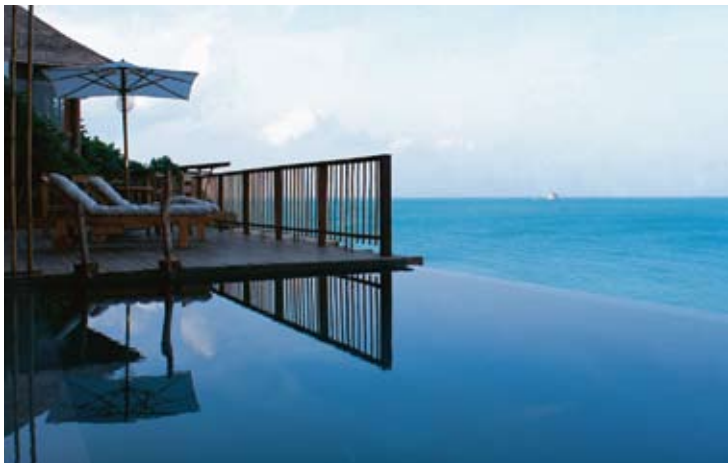
Pool Villa Seaview

*SUSTAINABLE - LOCAL - ORGANIC - WHOLESOME LEARNING - INSPIRING - FUN - EXPERIENCES