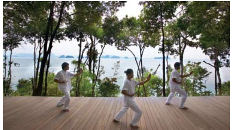
Qi Gong platform

Unser ganzheitlich ausgerichtetes Six Senses Spa bietet entspannende, wiederbelebende und verjüngende Erlebnisse. Ausgebildete Therapeuten kreieren eine tiefgründige Reise der Sinne, durch spezielle Wellness- und Wohlfühlbehandlungen. Das Spa ist im Stil eines asiatischen Long-Hauses gebaut mit Blick auf den üppig tropisch bewaldeten Hang.