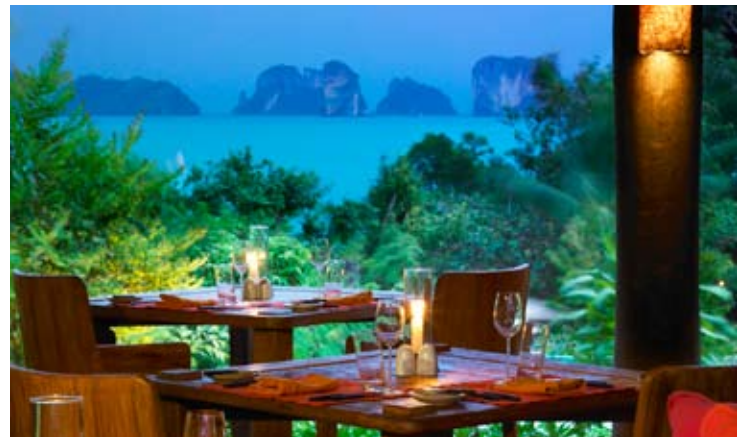
The Living Room

Der offene Barbereich befindet sich auf zwei Ebenen mit mehreren Zwischenebenen, die eine angenehme Privatsphäre einräumen. Hier werden asiatische Tapas und eine spezielle Auswahl an regionalen Gerichten geboten. Dieser Bereich verfügt ebenfalls über einen kleinen Konferenzraum.