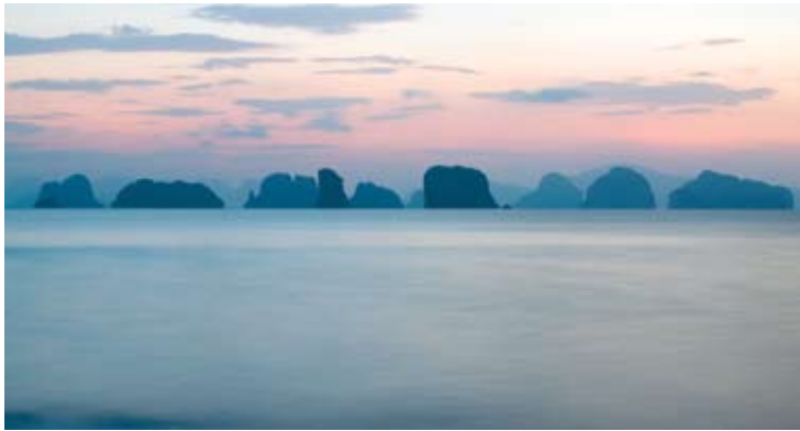
Phang Nga Bay

Anreise mit dem Motorboot vom Flughafen Phuket beträgt zwischen 45 Minuten und einer Stunde.