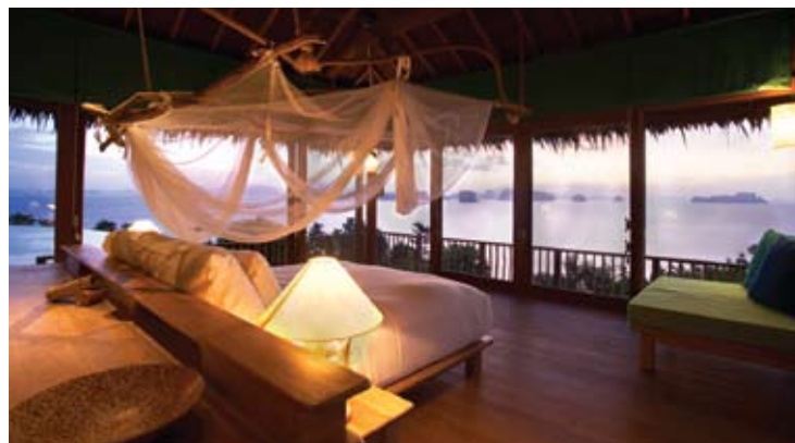
Hill Top Reserve