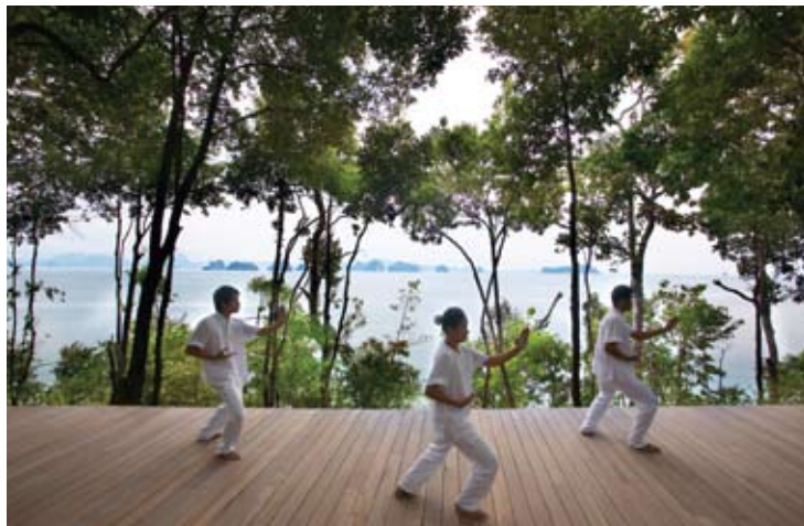
Qi Gong platform

ホリスティックなシックスセンススパでは心身共にリラックスした、甦らせるトリートメントを提供しています。高い技能をもったセラピストが、最適な健康法ときめ細やかなトリートメントで、お客様をおもてなしいたします。アジアの長屋スタイルのスパは熱帯林に面しており、独立したスパ東屋やジムもございます。