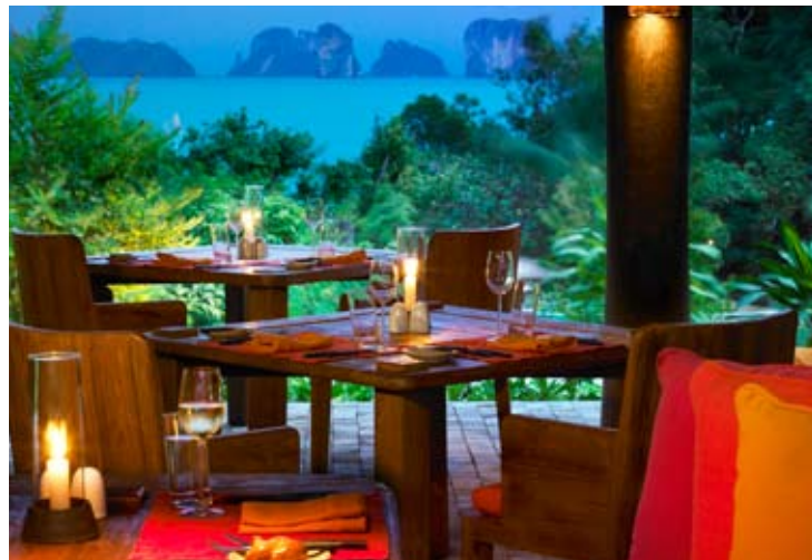
The Living Room

プールの横を通り、2軒のバーとラウンジを過ぎるとシックスセンス・ハイダウェイの心地良い静けさを感じていただけることでしょう。左手にゲスト・リレーションとライブラリ、右手にバーを見ながら進むとザ・デンに通じます。ライブラリにはガラス張りでデュプレックス構造のワインセラーがあり、上階へは吊りはしこで登ることができます。開放感のあるバー