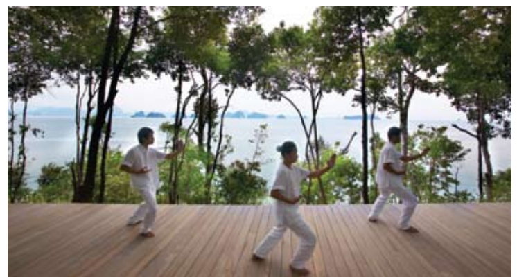
Qi Gong at Six Senses Spa

Спа центр Six Senses, основанный на холистическом подходе, способен предложить поистине расслабляющий и восстанавливающий цикл процедур, терапевтический эффект которых не заставит себя ждать. Квалифицированные специалисты приложат все усилия, чтобы гости попробовали путешествие в мир Шести Чувств, используя различные техники массажа. Спа центр, созданный в традиционном стиле азиатских домов, находится на холме с тропической растительностью. В дополнение к этому здесь существует несколько отдельных павильонов для массажа и спорт зал.