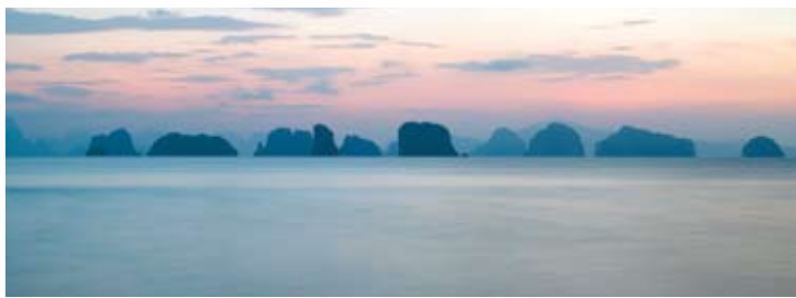
Phang Nga Bay

Курорт Six Senses Hideaway Yao Noi расположен на острове Yao Noi, который находится между островами Пхукет (Phuket) и Краби (Krabi), среди впечатляющих известняковых вершин района Пхан-Нга (Phang Nga). Время в пути от островов Пхукета или Краби около 45 минут до часа на моторной лодке.