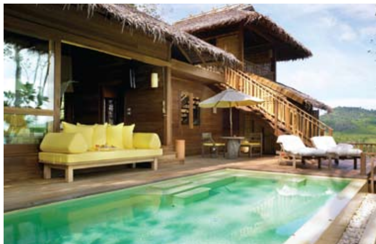
Deluxe Pool Villa