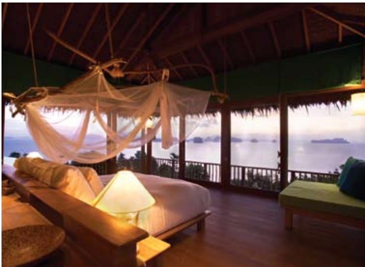
The Hilltop Reserve Master Bedroom