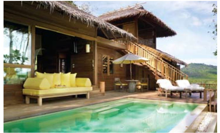
Deluxe Pool Villa

Pool Villa – 泳池别墅 (29间) 每单元总面积为154平方米 (80平方米为室内区域, 56平方米为室外区域, 18平方米为私人游泳池)