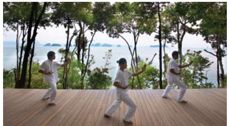
Qi Gong at Six Senses Spa

第六感觉SPA提供完整的SPA健疗服务, 可营造真正使身心放松和恢复健康活力疗养服务。本SPA提供多样而齐全的SPA疗养清单, 以及一系列的恢复身心活力疗法。这里高超技艺的理疗师, 可为顾客创造真正的身心休闲之旅。风格广泛的健身与呵护疗法, 在传统的山边亚洲式长屋, 将身心融入林木茂密的回归大自然的气氛中。分设有多个室内和室外凉亭SPA疗养按摩服务区。