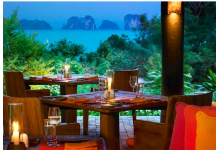
The Living Room & Terrace

当顾客来到第六感觉海德威度假村, 从进入到大堂起, 就能产生全新的体验。穿越大堂内的水池、两个凹型设计的酒吧, 以及座椅区。有多条走道, 分别引向 The Den 柜台、顾客咨询服务台、一个图书室以及右边的一座小酒吧。玻璃室设计的双层葡萄酒窖, 以及悬吊式的梯子, 通向葡萄酒窖的第二层。同时, 第二层还有一间自由敞开式的小酒吧。