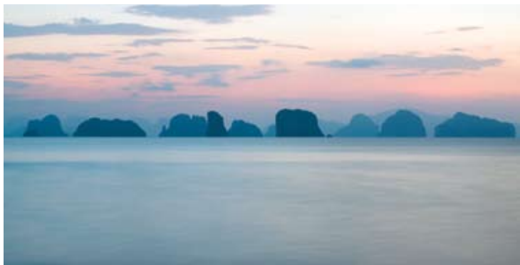
Bahía de Phang Nga

Six Senses Hideaway Yao Noi está situado en la Isla Yao Noi, entre Phuket y Krabi, donde se encuentran las elevadas y puntiagudas rocas calizas de Phang Nga. Desde el Aeropuerto Internacional de Phuket se tarda unos 40-60 minutos en lancha motora.