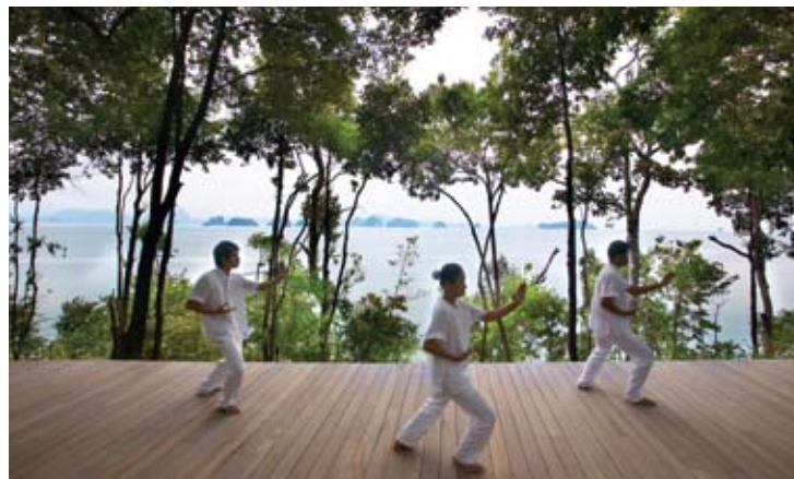
Haciendo Qi Gong en el spa

El balneario holístico Six Senses Spa pone a su alcance una experiencia realmente auténtica y revitalizante gracias a sus terapéuticos menús para rejuvenecer y revitalizar los sentidos. Expertos terapeutas han diseñado verdaderos viajes sensoriales para los huéspedes, que comprenden un amplio abanico de procedimientos holísticos y de wellness. El gran lounge de estilo asiático se levanta entre la exuberante vegetación tropical de la colina, donde también se encuentran pequeñas salas de tratamiento privadas y un gimnasio.