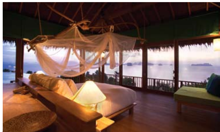
The Living Room and Terrace (El Salon y la Terraza) Habitación principal de la villa Hill top reserve

Los clientes experimentan una refrescante sensación de calma cuando entran en el Six Senses Hideaway Yao Noi atravesando la piscina de entrada, con sus dos bares hundidos y sus zonas de descanso. Desde aquí parten varios caminos. Uno lleva al Den dejando a la izquierda la recepción y la biblioteca y a la derecha el open-bar. La biblioteca incluye una bodega acristalada a la que se accede mediante dos escaleras colgantes para llegar a los vinos situados en la planta superior. El bar de diseño abierto también se eleva en dos plantas con diferentes subniveles destinados a crear un ambiente íntimo. Ofrece una muestra de Tailandia, con su selección de noodles (fideos) y especialidades regionales. Esta área también dispone de una pequeña sala de conferencias. Por otro de los caminos se accede a las zonas de restauración, pasando por la Six Senses Gallery que ofrece multitud de ideas para regalos, decoración y ropa.