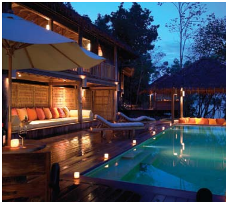
Villa The Retreat (el retiro)