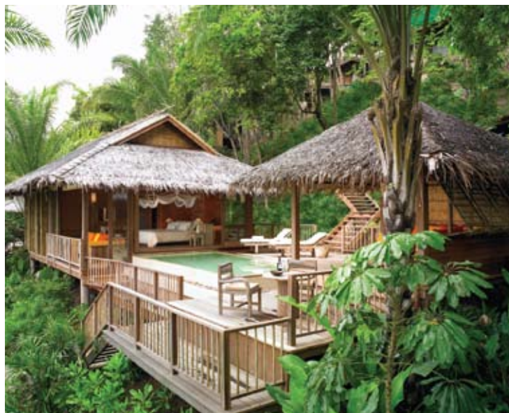
Villa con piscina