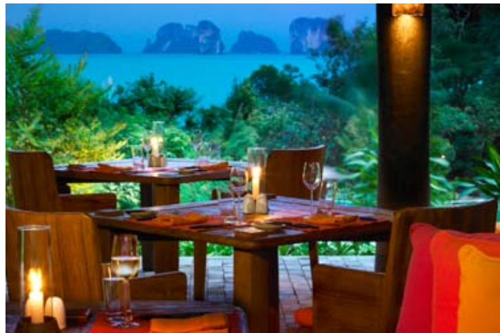
Restaurante The Living Room