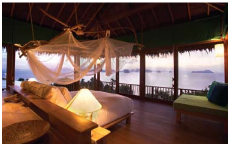
The Hilltop Reserve Master Bedroom