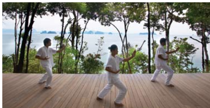
Qi Gong at Six Senses Spa

第六感覺SPA所提供完整的SPA健康服務, 可營造真正使身心放鬆和恢復健康活力療養服務。本SPA提供多樣而齊全的SPA療養清單, 以及一系列的恢復身心活力療法。這裡高超技藝的理療師, 可為顧客創造真正的身心休閒之旅。風格廣泛的健身與呵護療法, 在傳統的山邊亞洲式長屋, 將身心融入林木茂密的回歸大自然的氣氛中。分設有多個室內和室外涼亭療養按摩服務區。