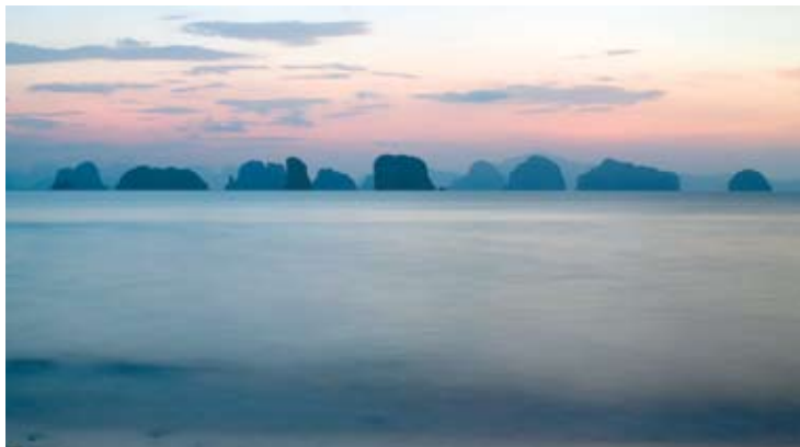
Phang Nga Bay

第六感覺海德威度假村 (Six Senses Hideaway Yao Noi) 座落在 甲米府普吉島之間的攀牙府海中小長島 (Yao Noi Island)，海德威度假村似乎被藏在攀牙灣令人讚嘆的海邊石灰岩叢林之中。從普吉或者甲米乘坐快艇前往，大約需要45分鐘到1小時的船程。