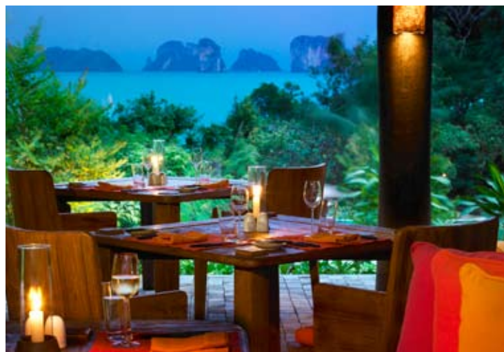
The Living Room & Terrace

每當顧客來到第六感覺海德威度假村, 從進入到大堂起, 就能產生全新的體驗。穿越大堂內的水池、兩個凹型設計的酒吧, 以及座椅區。有多條走道, 分別引向 The Den 櫃台、顧客諮詢服務台、一個圖書室以及右邊的一座小酒吧。玻璃室設計的雙層葡萄酒窖, 以及懸吊式的梯子, 通