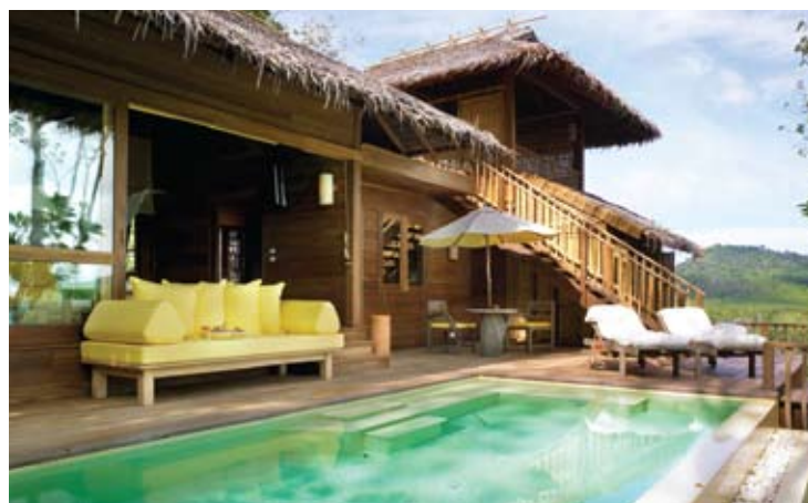
Deluxe Pool Villa

Pool Villa - 泳池別墅 (29間) 每單元總面積為154平方米 (80平方米為室內區域, 56平方米為室外區域, 18平方米為私人游泳池)