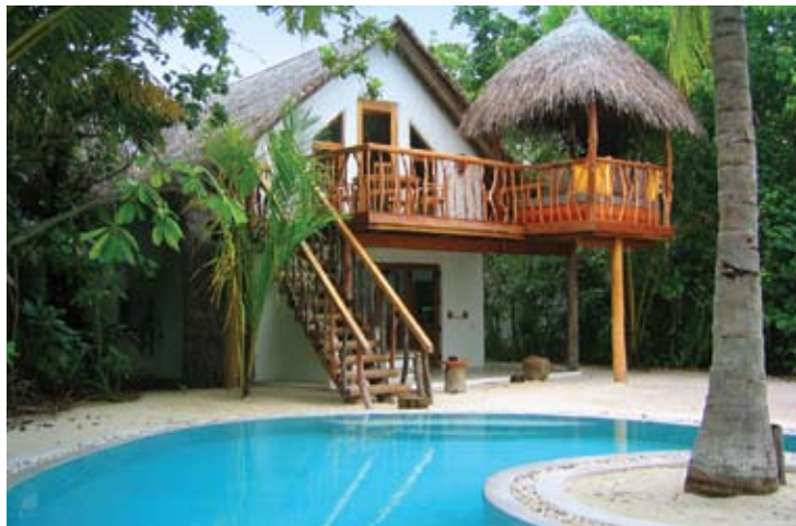
Crusocé Villa (with pool)