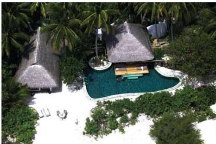
Jungle Reserve Aerial View