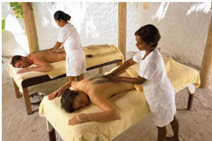
Private Spa Champa