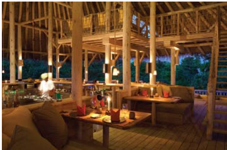
Fresh in the Garden Restaurant

Boutique, communications internationales, garde d'enfants, pressing, service en chambre, lecteurs de DVD et compacts disc, la plupart des cartes de crédit sont acceptées.