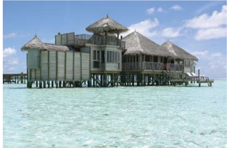
Soneva Gili Residence