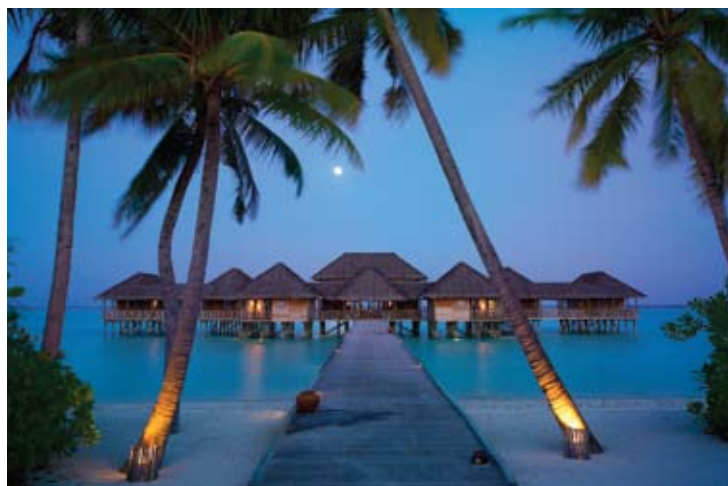
Six Senses Spa

Das Six Senses Spa bietet eine große Auswahl an ganzheitlichen Therapien und Programmen, die von international ausgebildeten Therapeuten, Trainern der ganzheitlichen Wellness und einem resorteigenen Ayurvedischen Doktor durchgeführt werden. Bodenpaneele aus Glas unter den Massagetischen erhöhen das sinnliche Erlebnis; während eine maledivische Sandmassage noch eine weitere neue Selbsterfahrung bringt. Des Weiteren ist das Spa mit fünf Behandlungszimmern über dem Wasser, Yoga/Tai Chi Champa, Dampfbädern, Entspannungsräume, eine Sauna und einem voll ausgestatteten Überwasser-Fitnessbereich eingerichtet.