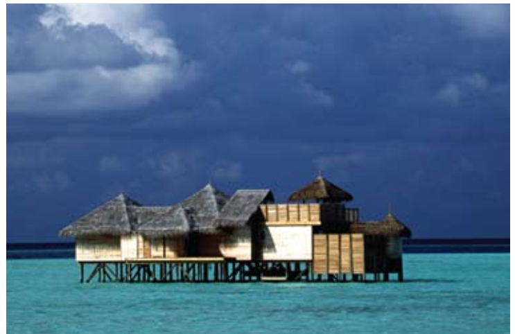
Soneva Gili Crusoe Residence