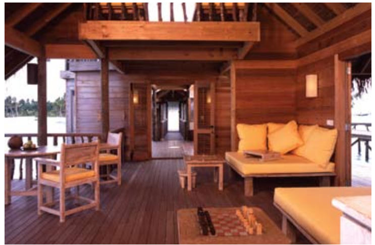
Soneva Gili Villa Suite (Interior)