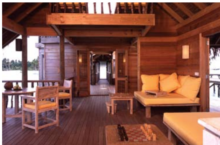
Soneva Gili Villa Suite (Interior)