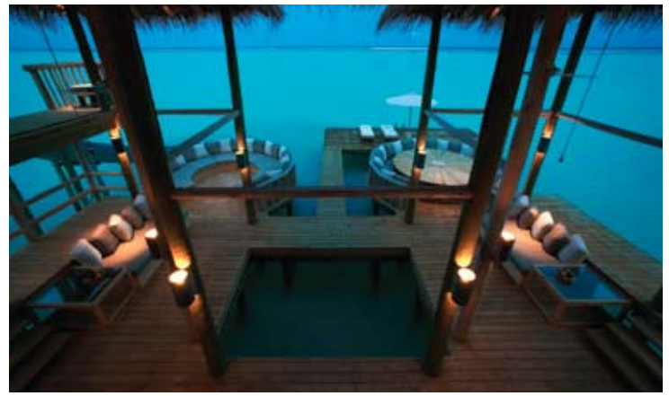
Private Reserve (Interior)