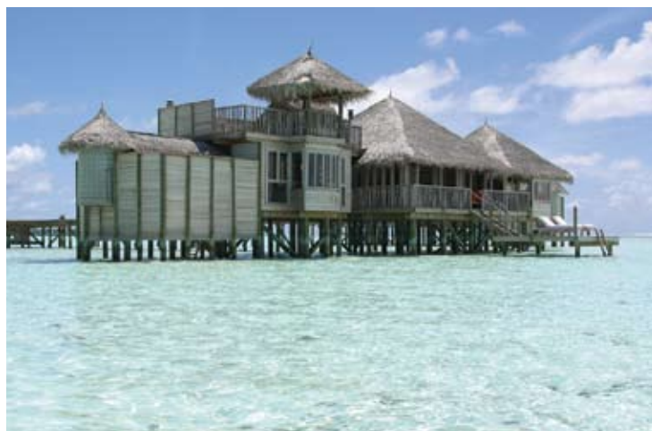
Soneva Gili Residence