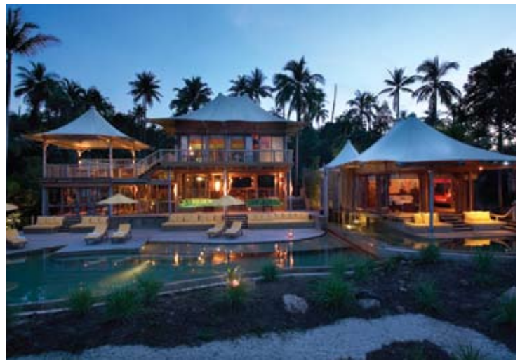
Beach Villa Suite

1 suite Beach Villa avec bibliothèque - superficie totale de 568 m 2 , dont 433 m 2 d'espace à vivre et une piscine de 135 m 2