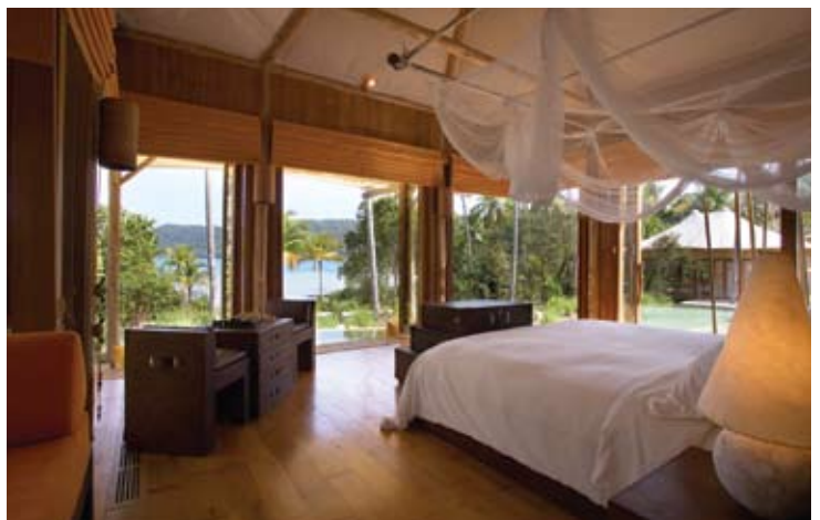
Beach Villa Suite Bedroom