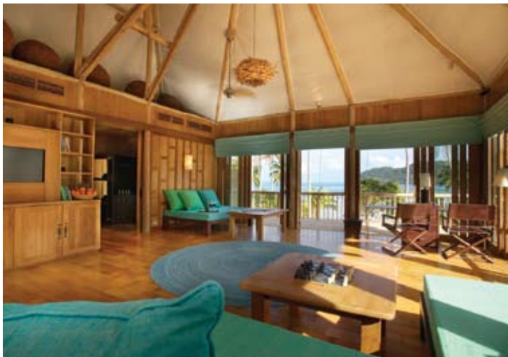
Beach Villa Suite Livingroom