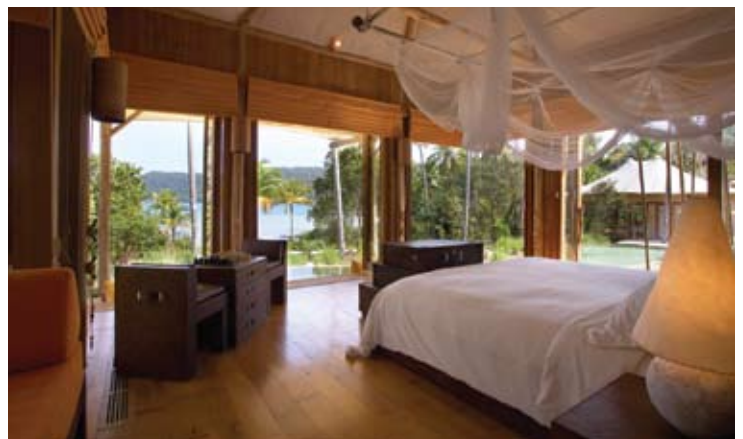
Beach Villa Suite Bedroom