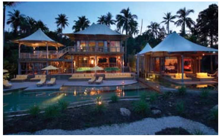
Beach Villa Suite