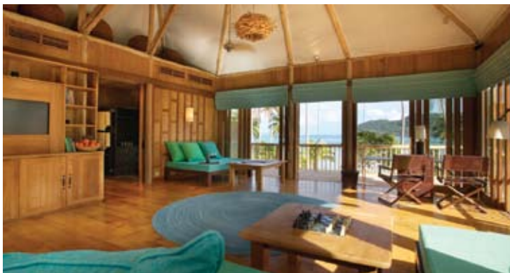
Beach Villa Suite Livingroom