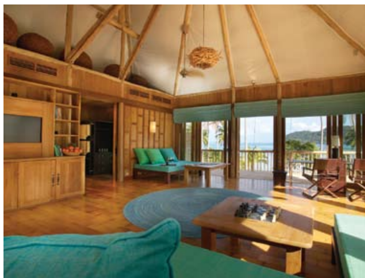
Beach Villa Suite Livingroom