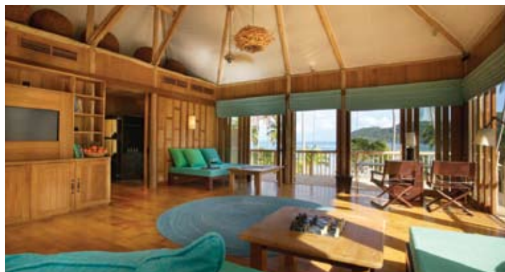
Beach Villa Suite Livingroom