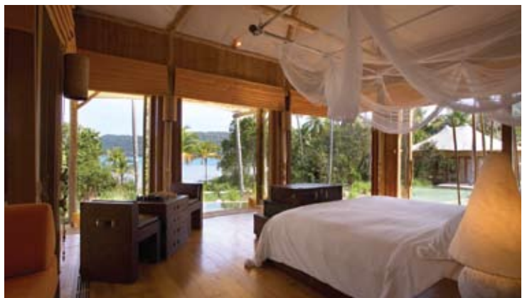
Beach Villa Suite Bedroom