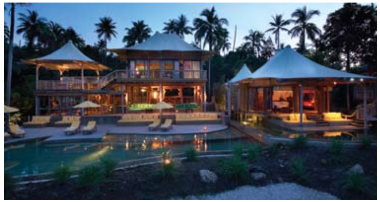
Beach Villa Suite