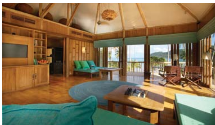
Beach Villa Suite Livingroom