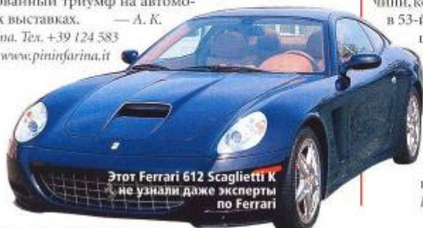
Этот Ferrari 612 Scaglietti K не узнали даже эксперты по Ferrari

Pininfarina. Тел. +39 124 583 401, www.pininfarina.it